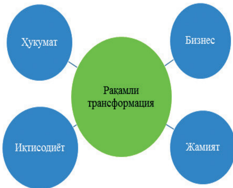
1-расм. Рақамли иқтисодиёт платқормаси.

Рақамли иқтисодиёт – бу нолдан бошлаб яратилиши лозим бўлган қандайдир бошқача иқтисодиёт эмас. Бу янги технологиялар, платформалар ва бизнес моделлари яратиш ва уларни кундалик ҳаётга жорий этиш орқали мавжуд иқтисодиётни янгича тизимга кўчириш деганидир.