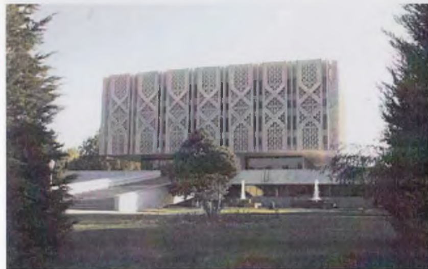
Ўзбекистон тарихи давлат музейи биноси.