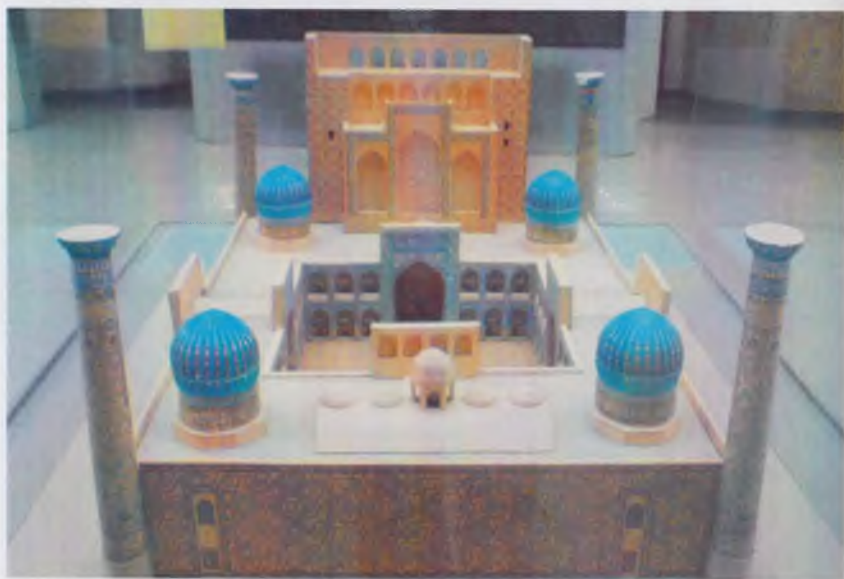
Темурийлар тарихи давлат музейининг экспозициясидан лавҳа.