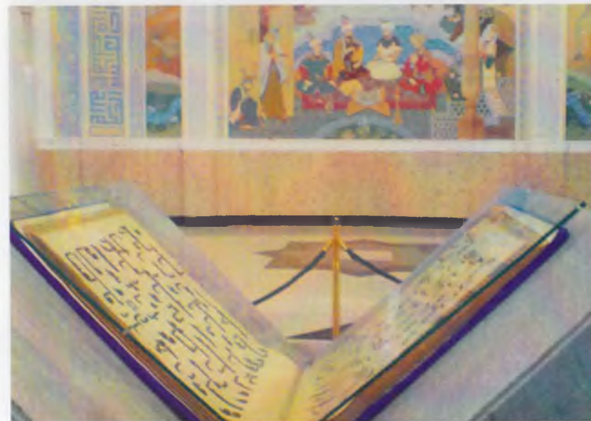
Темурийлар тарихи давлат музейининг экспозициясидан лавҳа.