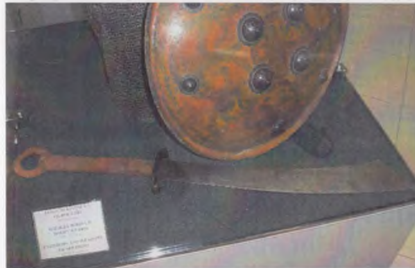
Ўзбекистон тарихи давлат музейининг кулолчилик буюмлари экспозициясидан лавҳа.