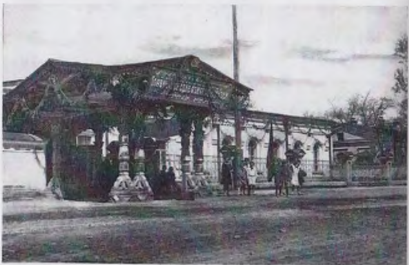
Ўрта Осиё музейининг биноси. 1920 йил.