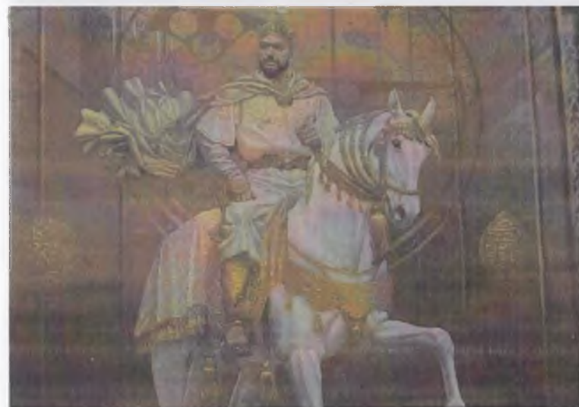
Ўзбекистон тарихи давлат музейи экспозициясидаги Амир Темур тасвирланган деворий суратидан лавҳа.