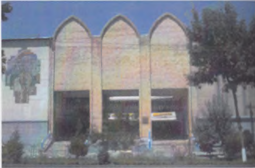
Наманган вилоят ўлкашунослик музейининг биноси.