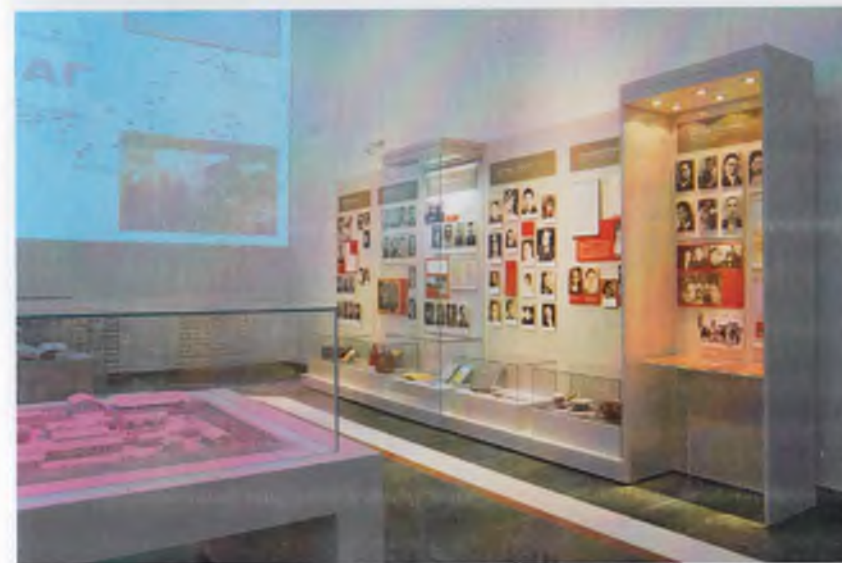
Қатагон қурбонлари хотираси музейининг экспозицион залларидан лавҳалар.