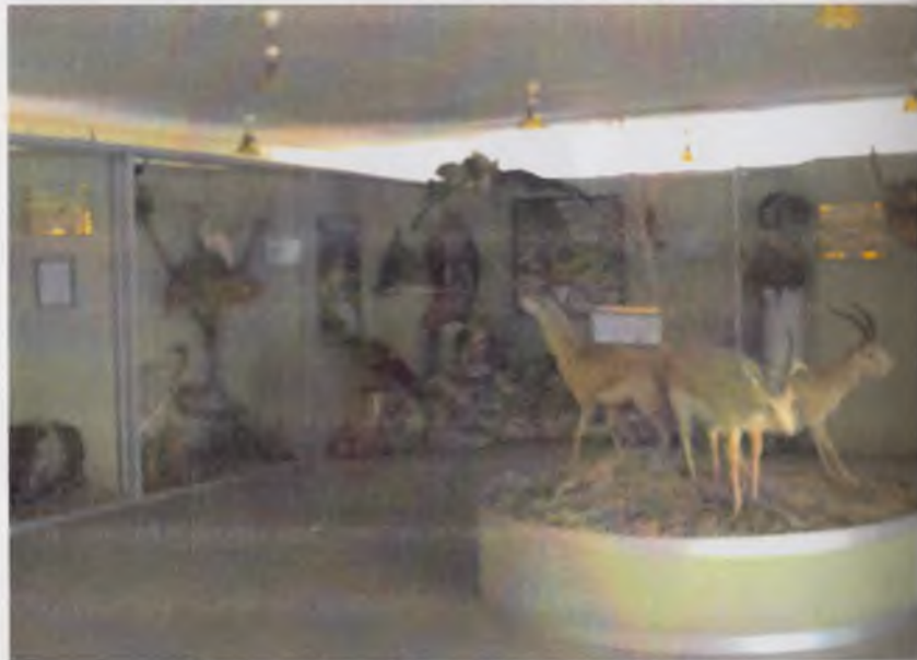
Наманган вилоят ўлкашунослик музейи экспозициясидан лавҳа.