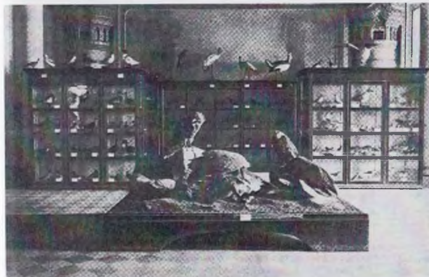
Ўрта Осиё музейининг қушлар коллекцияси экспозицияси.