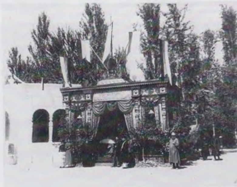
Туркистон кўрғазмаси. “Ака-ука Яушевлар” савдо уйи павильони. 1890 йил.