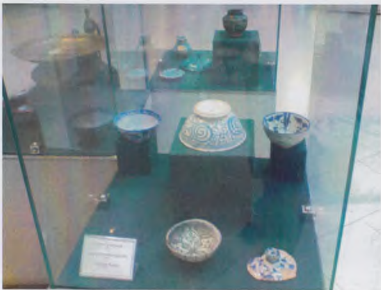
Темурийлар тарихи давлат музейининг экспозициясидан лавҳа.