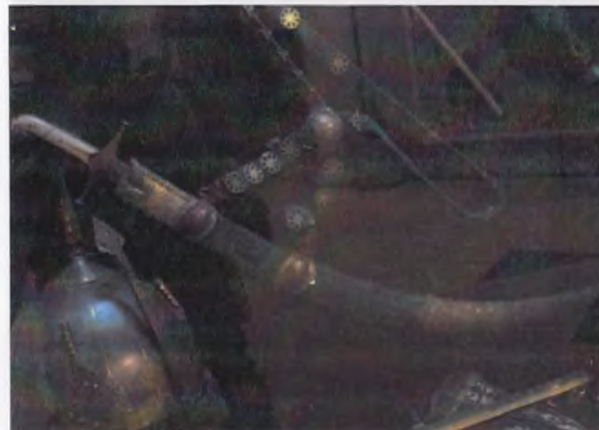
Ўзбекистон тарихи давлат музейининг кулолчилик буюмлари экспозициясидан лавҳа.