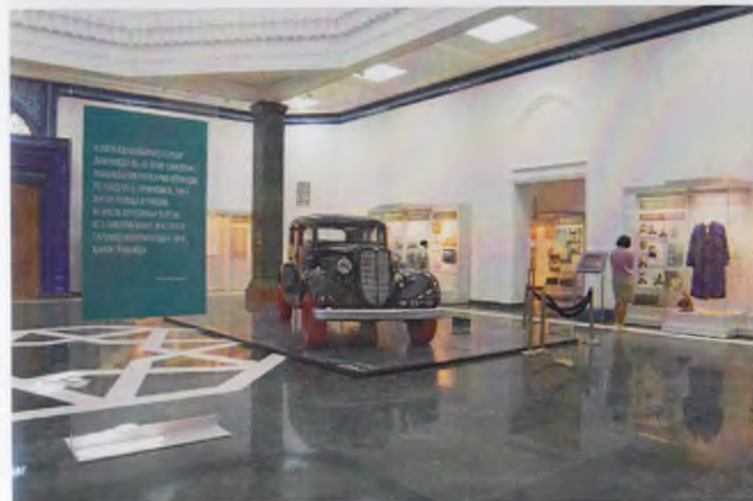
Қатагон қурбонлари хотираси музейининг экспозицион залларидан лавҳалар.