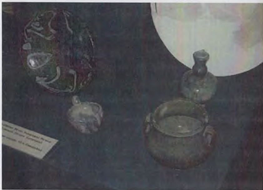
Ўзбекистон тарихи давлат музейининг кулолчилик буюмлари экспозициясидан лавҳа.