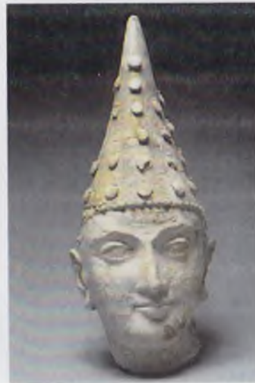
Шахзода хайкали боши (I-III асрлар, Далварзинтепа). Донатор хайкали (милод. авв. I аср, Далварзинтепа).