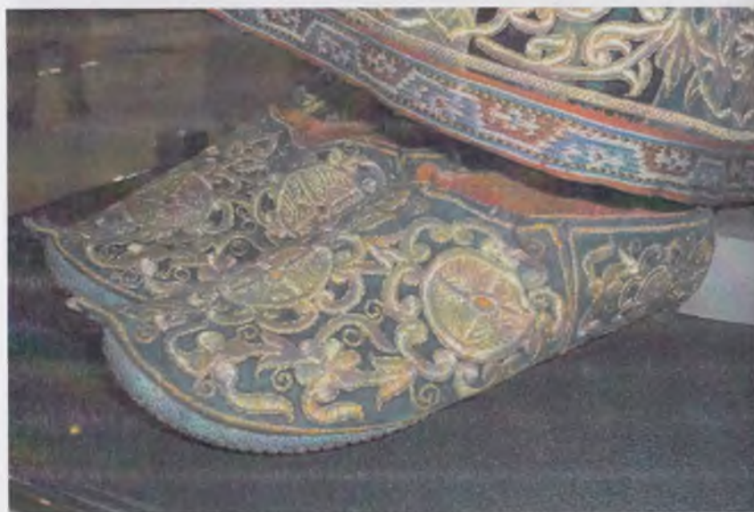
Ўзбекистон тарихи давлат музейининг кулолчилик буюмлари экспозициясидан лавҳа.