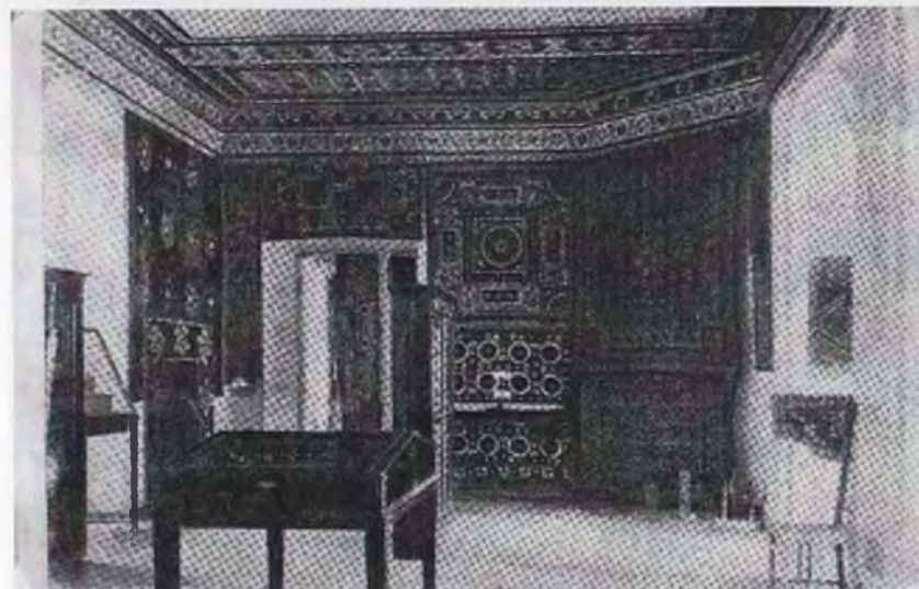
Ўрта Осиё музейининг экспозицион залидан лавҳа.