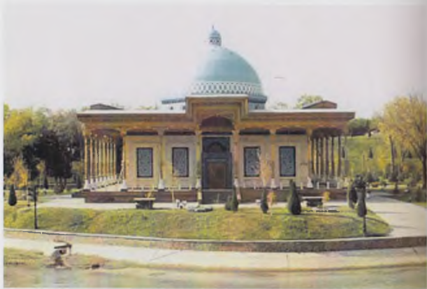
Қатагон қурбонлари хотираси музейининг ilk биноси.