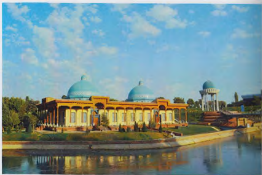
Қатагон қурбонлари хотираси музейининг янги биноси.