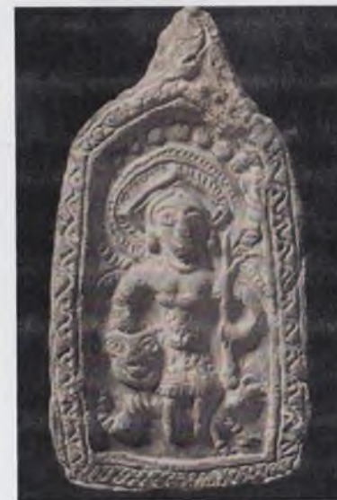
Плакетка (пиширилган лой, VI-VII асрлар Далварзинтепа). Тохаристон санъати намунаси. Оташдон. (милод. авв. VI аср, Болаликтепа )