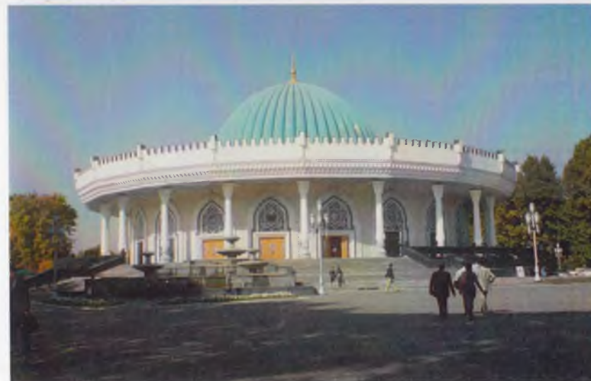
Темурийлар тарихи давлат музейининг биноси