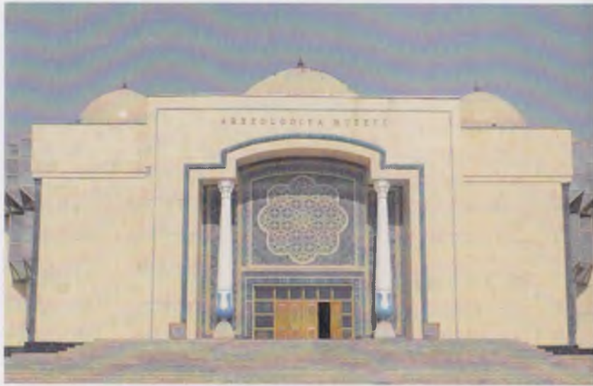
Термиз археология музейининг биноси.