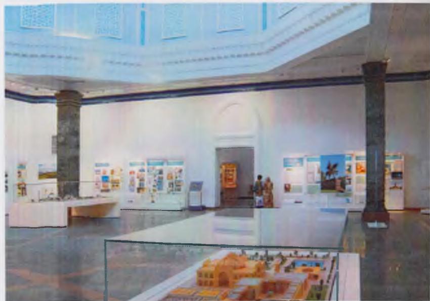
Қатагон қурбонлари хотираси музейининг экспозицион залларидан лавҳалар.