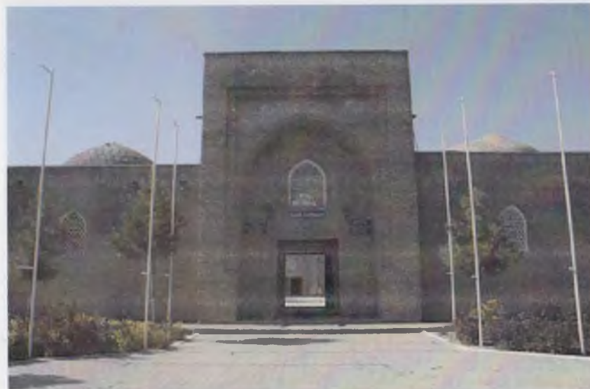
Амир Темуր номидаги Моддий маданият тарихи музейининг биноси