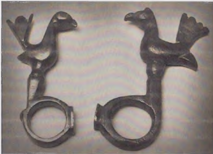
Термиз археология музейи экспонатлари: Чироқ тутғич (эез, қуйма усул).