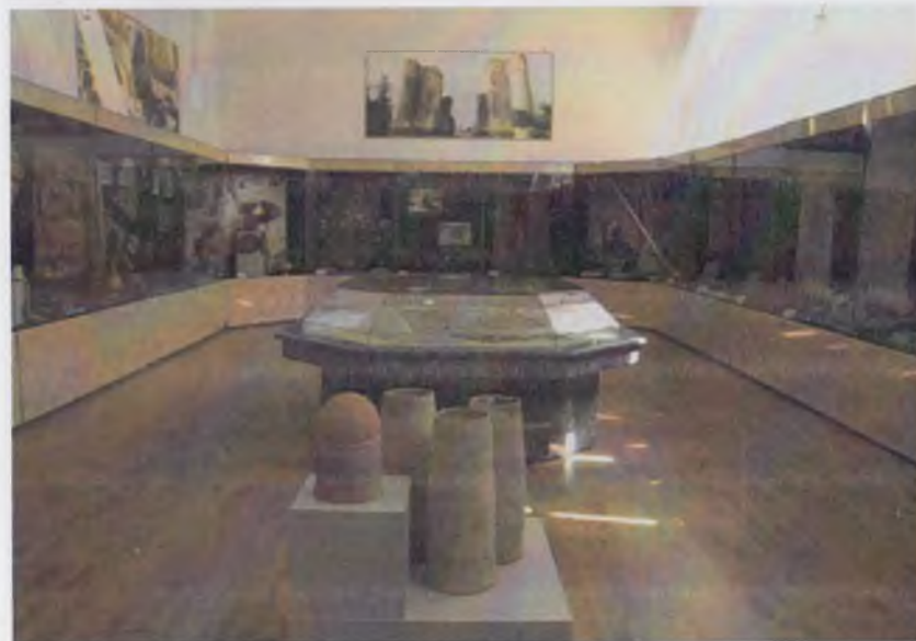
Амир Темур номидаги Моддий маданият тарихи музейининг экспозициясидан лавҳа.