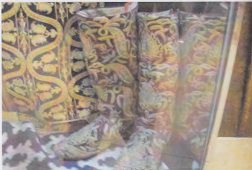
Ўзбекистон тарихи давлат музейининг кулолчилик буюмлари экспозициясидан лавҳа.