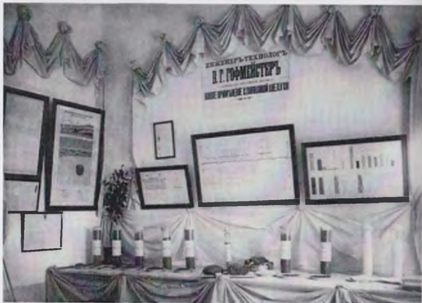
Қишлоқ хўжалиги ва саноат кўргазмаси. Тошкент, 1894 йил.