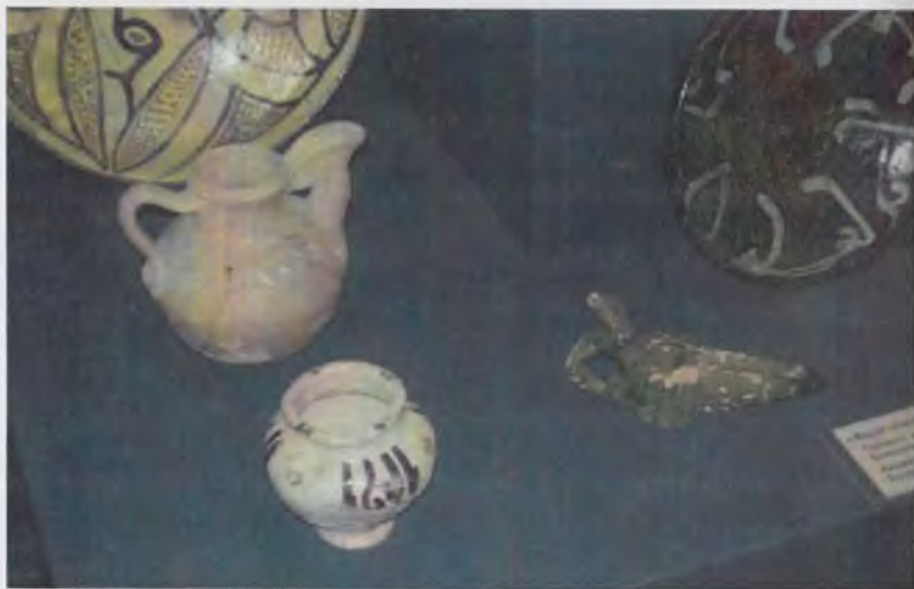
Ўзбекистон тарихи давлат музейининг кулолчилик буюмлари экспозициясидан лавҳа.