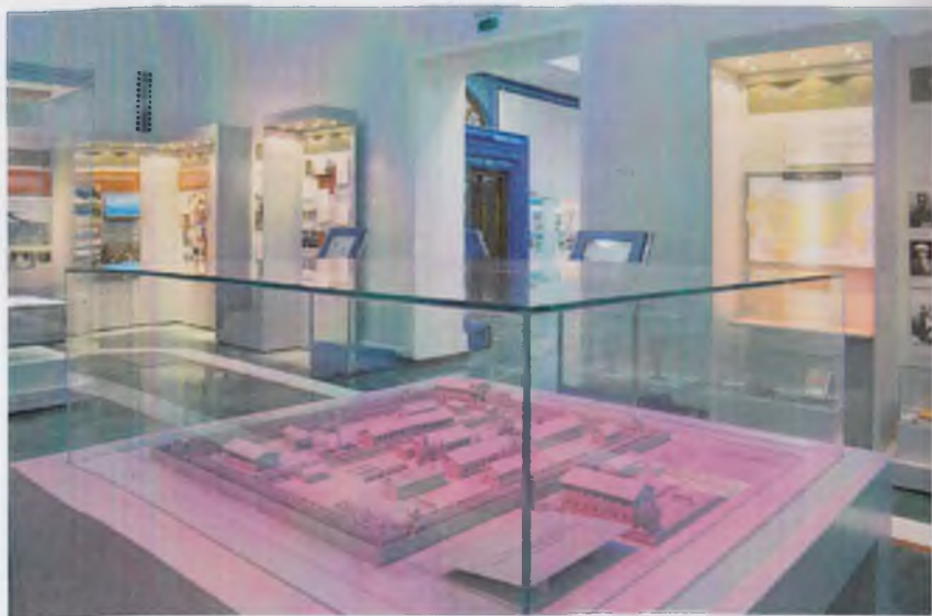
Қатагон қурбонлари хотираси музейининг экспозицион залларидан лавҳалар.