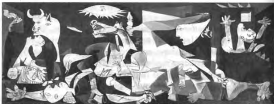
П. Пикассо. Герника.