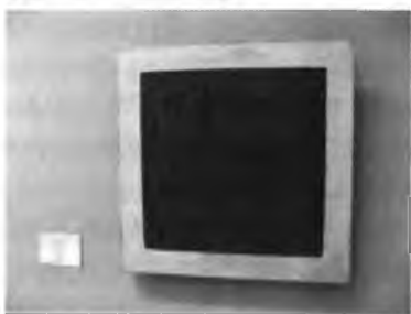
К. Малевич. Қора квадрат.

Йўналишнинг олдинги сафида рус санъати намояндаси, суперматизм (лотинча supremis – олий) асосчиси К. Малевич ва унинг издошлари борди. К. Малевич 1915 йили ўзининг машхур «Қора квадрат»ини яратди. Модернистик санъатнинг бу мактаби кубизмга қарши йўналиш сифатида пайдо бўлди ва нарсалар олами билан ҳар қандай боғлиқликдан маҳрум бўлган предметсиз тасвир даражасига чиқди. 1920-йиллари француз Р. Делоне, голландиялик П. Мондриан, россиялик К. Малевич, чех рассоми Ф. Купка ва бошқалар бу йўналиш вакиллари эди. Стил эволюциясининг символизмдан бошланган бошқа бир оқими абстракт тасвирий санъатнинг ноёб усули пайдо бўлишига олиб келди. В. Кандинский асос солган абстракционизм усули амалда ўзининг бевосита давомчиларига эга бўлмади. В. Кандинский ижоди ҳам рус, ҳам немис авангардига бирдай тегишли. Агар предметсизлик воқелик билан барча келишувларни кубизм босқичида қолдириб, аниқлик билан қатъий ажралиш йўлидан борса, Кандинский абстракционизми аста-секин реал шакллардан халос бўлади (абстракциялашади) ва хусусийдан умумийга қараб боради.