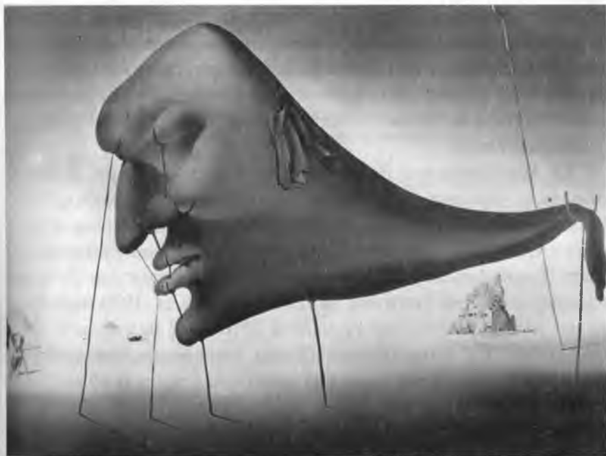
С. Дали. «Буюк эсини».

1920 –1930-йиллари халқаро бадиий кенглик шаклланди, бадиий йўналишлар халқаро характер касб этди, дунё халқлари маданияти ва санъатининг ўзаро таъсири кучайди. Аммо бу жараёнда минтақавий, цивилизациявий фарқлар кўзга ташланади. Биринчи жаҳон урушидан кейин мустақилликка эришган Шарқий ва Жанубий Европа мамлакатларида абстракционизм ва иррационал оқимларнинг таъсири унча кучли эмасди. Бу мамлакатларда санъат ривожига миллий давлатчилик ғоялари ҳал қилувчи таъсир кўрсатди. Бу мамлакатлар рассомлари миллий санъат ривожланиши концепциясининг икки йўналишидан бирига риоя қилади. Бир гуруҳи замонавий санъат ва оқимларга қўшилиш учун «Париж мактаби»га мурожаат қилди. Биринчи навбатда, қайта тикланган реализм билан боғлиқ «янги традиционализм» тажрибаси ўрганилди. Бошқа концепция миллий анъаналарга таянди. Улар олдиларига хусусий, янги, замонавий, миллий санъатни яратиш ва-нифасини қўйдилар. Шу сабабли мумтоз меросга, миллий бадиий