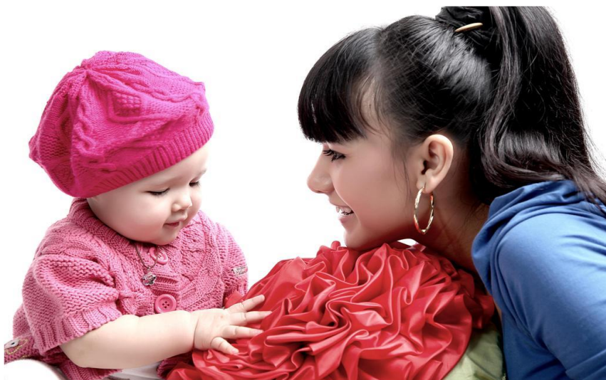
Она ва фарзанд.