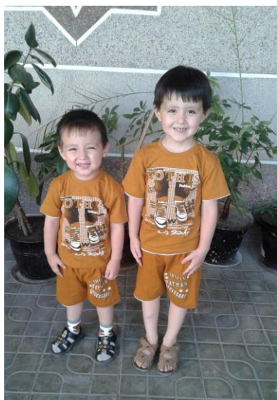
Ака ва ука.