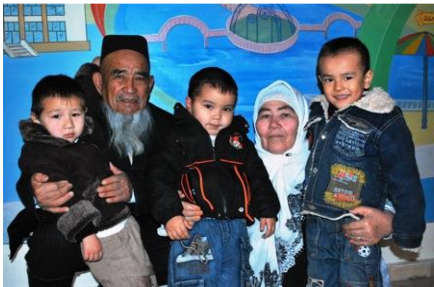
Буви ва Бувалар ҳар доим эъзозда.