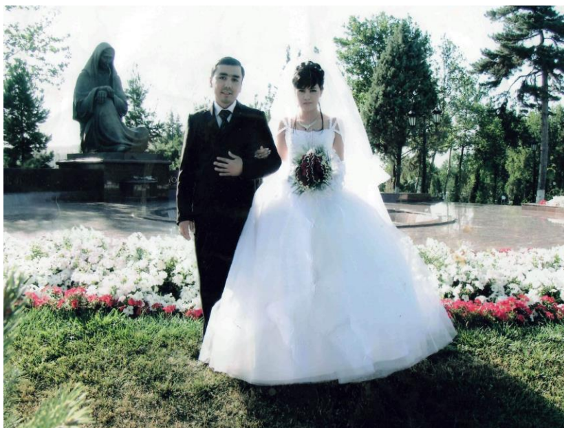
Оила қуриш арафасида.