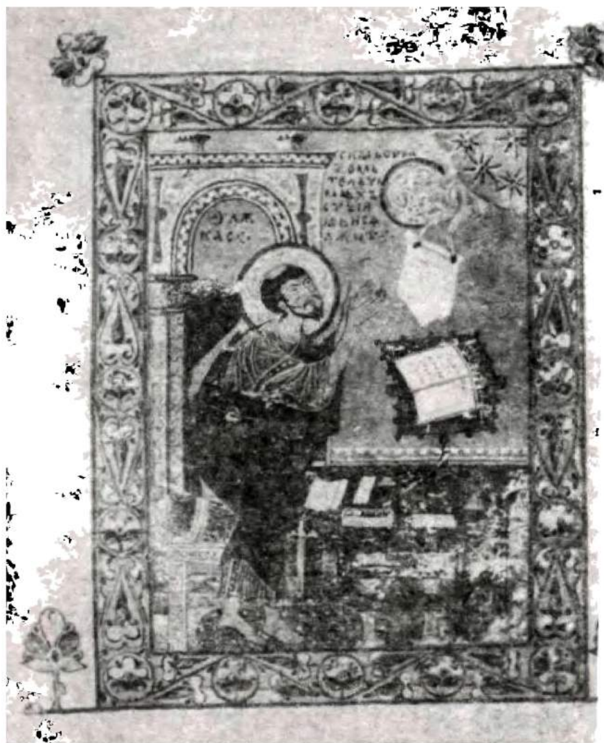
Миниатюра из Остромирова евангелия 1056—1057 гг.