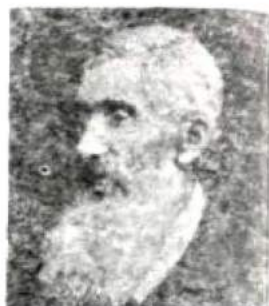
Измаил Иванович Срезневский

дворянства и в городах, близлежащих к Москве; поморское — это все северновеликорусское наречие, т. е. окающие говоры, по мнению Ломоносова, это наречие ближе к „славенскому“ старому языку. Третье, малороссийское, было названо им так потому, что украинский язык как литературный тогда еще не оформился. Ломоносов писал, что это наречие ближе к польскому языку и отлично от остальных двух наречий. Таким образом, Ломоносов, хотя и не выделил белорусского языка и не разделил южно- и средневеликорусские говоры, все же наметил основные наречия русского языка и указал их границы.