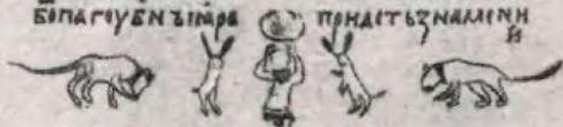
Лист из Изборника Святослава 1073 г.

НЪ. РАДЪШНТИ ЖЕНХЪН. ВЛАЖАХУ. ИЖЕОНААЪПОВУ СТНЕЪ. ТРАНКОЖЕ ТЪУЪЖЕТВОРН. ША. ИЖЕУЕОНЪДА БАВНОКЪИ. АШТЕ ВЪСТННВЪТБЕПР РОКЪ. ИАНВНАНЪ НЪ. ИАДЪТЪНАМ НИИНАНУЖЪИДА ПОНДЪТЪНАМНН