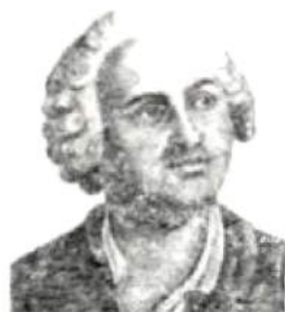
Михаил Васильевич Ломоносов