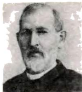
Федор Иванович Буслаев