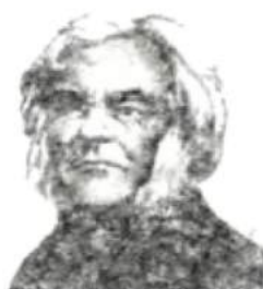
Александр Христофо- рович Востоков