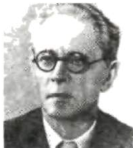
Леонид Арсеньевич Булиховский

Вопросам исторической фонетики в свое время уделял внимание и другой ученик Шахматова — В. В. Виноградов (1895—1969) (см. его „Очерки по истории звука ѣ в севернорусском наречии“, 1919), впоследствии занимавшийся вопросами изучения русского литературного языка, стилистики и языка писателя. В. В. Виноградов является создателем науки об истории русского литературного языка (см. его книгу „Очерки по истории русского литературного языка XVII—XIX вв.“ (изд. 1.—1934 г., изд. 3—1983 г.) и работу „Основные этапы истории русского языка“ в журнале „Русский язык в школе“ 1940, № 3—5, а также монографии и многочисленные статьи о языке крупнейших русских писателей — Пушкина, Гоголя, Достоевского, Толстого и др.). Большое значение для истории русского языка имеют работы В. В. Виноградова по лексике — по истории различных русских слов.