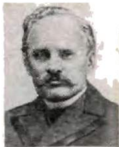
Алексей Александрович Шахматов

ция Буслаева, изложенная в „Опыте исторической грамматики русского языка“ (в последующих изданиях — „Историческая грамматика русского языка“), долгое время сохранялась в преподавании этой науки.