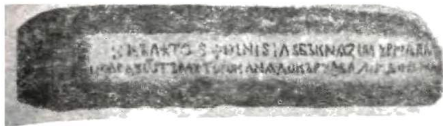
Надпись на Тьмутараканском камне 1068 г.

в настоящее время хранится в Публичной библиотеке им. Салтыкова-Щедрина в Ленинграде.