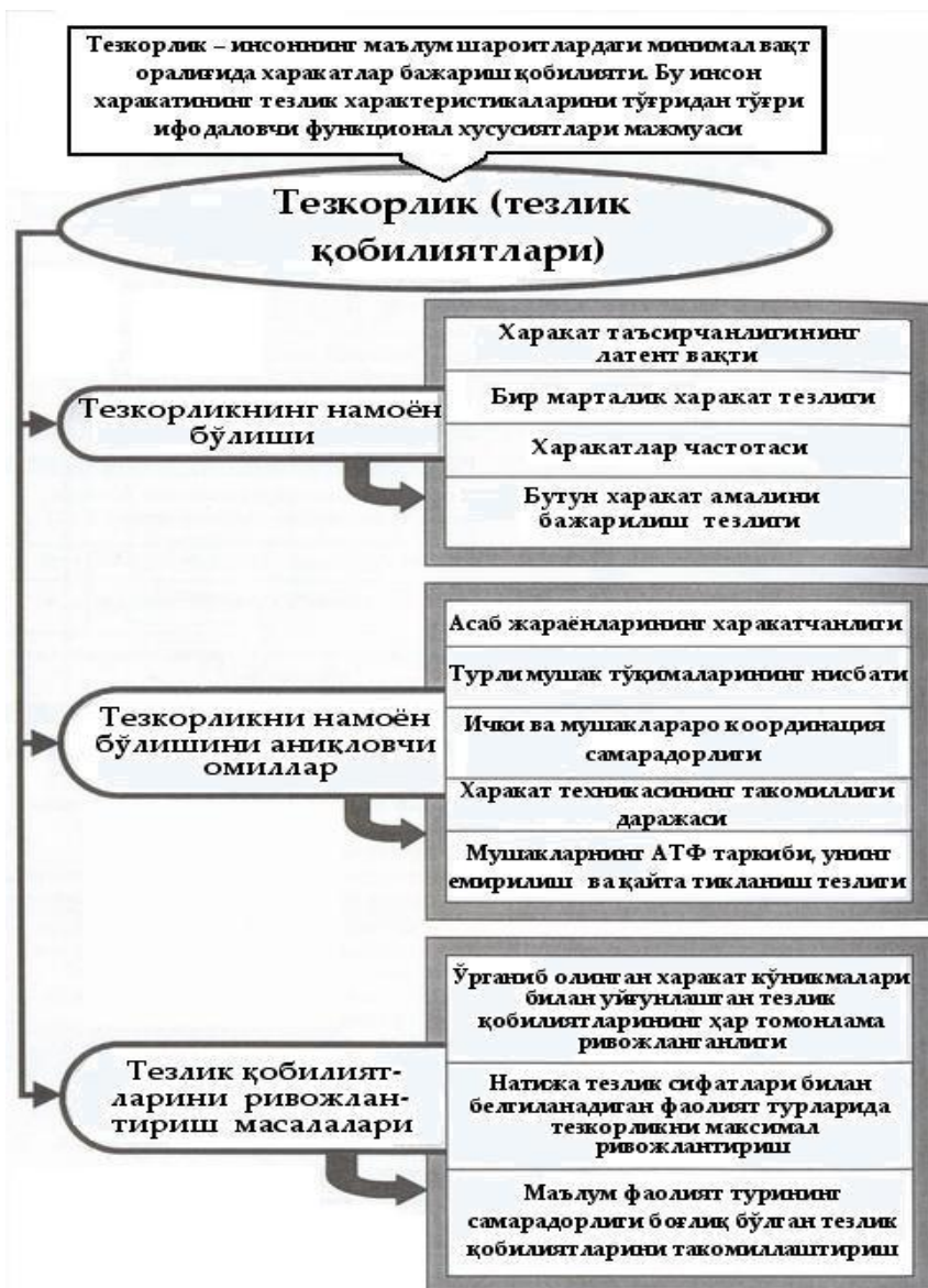
2-расм. «Тезкорлик» ҳаракат сифатининг умумий характеристикаси. (К.Д.Чермит бўйича, 2005)