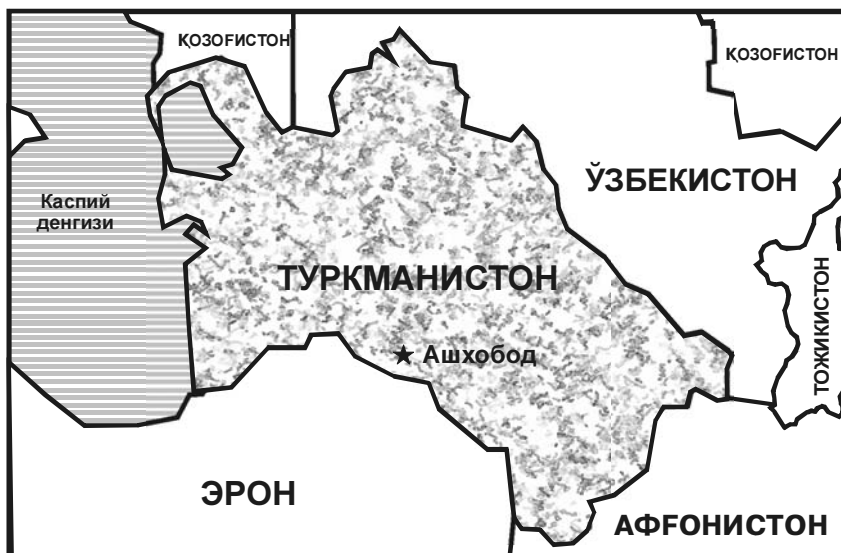
Туркменистон ва унга чегарадош давлатлар

Мамлакат ўз ташқи сиёсатида «позитив нейтралитет» йўлини тутмоқда.