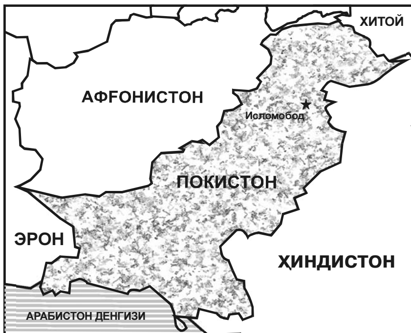
Покистон ва унга чегарадош давлатлар

Парвез Мушарраф эгаллади. 2002 йил октябрда бўлиб ўтган умум-халқ парламент сайловида Мушарраф ва унинг тарафдорлари ғалаба қозондилар. Лекин шу вақтга келиб Афғонистондаги воқеалар ҳамда 90-йилларда Исломобод ва Покистон армияси томонидан тўлиқ қўллаб-қувватланган толиблар тузумига қарши антитеррористик кампания муносабати билан мамлакатда вазият кескинлашди. Мушарраф мамлакат позициясини тубдан ўзгартиришга қарор қилди ва «Толибон» ҳаракатига қарши урушда АҚШни қўллаб-қувватлади. Бу мамлакатдаги ислом ақидапарастларининг қаттиқ норозилигига сабаб бўлди. Мушаррафга қарши сурункасига бир неча марта суиқасд уюштирилди. Аини вақтда, Покистон раҳбариятининг бу ҳаракати ўз самарасини берди. Мамлакатнинг жуда кўп миқдордаги ташқи қарзи реструктуризация қилинди, бир қисмининг эса баҳридан ўтилди. Покистон катта моддий ёрдам олди. Бу мамлакатнинг иқтисодий ривожланиш суръатларига ўзининг ижобий таъсирини кўрсатди. Ўз геосиёсий рақиблиари - қўшни мамлакатлардан иқтисодий тараққиётда орқада қолмаслик Покистон ҳукуматининг бош вазифасидир.