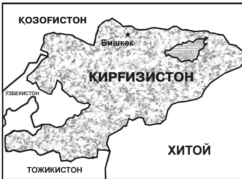
Қирғизистон ва унга чегарадош давлатлар

Қирғиз халқи кўчманчи халқлар тоифасига мансуб. Ўзининг кўп асрлик тарихи мобайнида у ҳозирги Монголиянинг шимоли-шарқий ҳудудларидан Сибирга, Енисей дарёси атрофига кўчиб келди ва XV-XVI асрлардагина ҳозирги Қирғизистон ҳудудига келиб жойлашди. Қўқон хонлиги назорати остида бўлган қирғизлар унинг тақдирини баҳам кўрдилар ва 1876 йилда чор Россияси томонидан босиб олиндилар. Анъанавий турмуш тарзининг бузилишига қарши бўлган қирғизлар миллий озодлик ҳаракатида, бир қанча қўзғолонларда иштирок этдилар. Қирғизларнинг бир қисми Афғонистон ва Хитойнинг тоғли ҳудудларига бош олиб кетди.