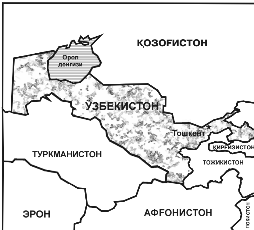
Ўзбекистон ва унга чегарадош давлатлар

катларнинг ҳар бири ўзбеклар гуж бўлиб яшайдиган муайян ҳудудларга эга. Тожикистонда аҳолининг 25%, Қирғистонда - 15%, Туркменистонда - 10%, Қозоғистонда - 3% га яқинини ўзбеклар ташкил этади. Турли баҳолашларга кўра, Афғонистонда 2-2,5 миллион ўзбек яшайди.