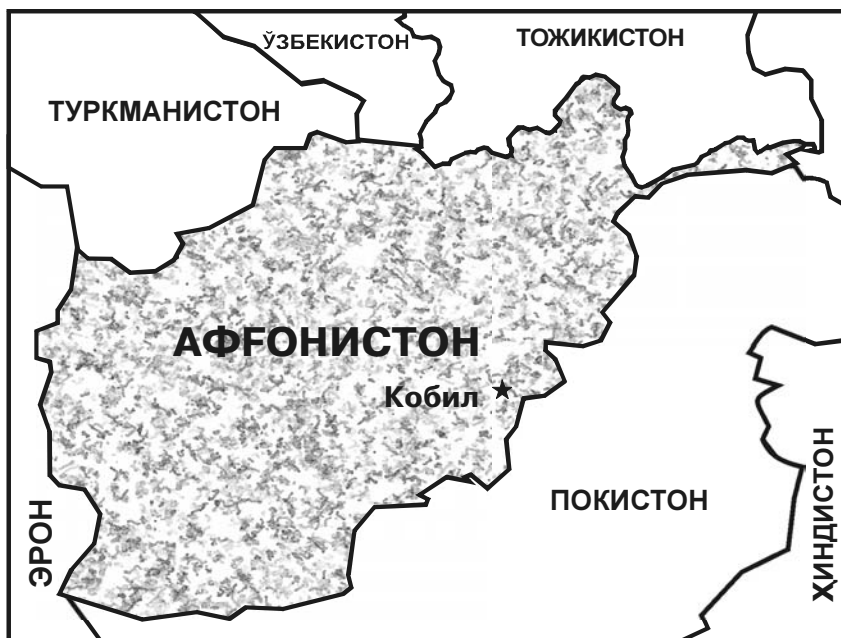
Афғонистон ва унга чегарадош давлатлар

Айни вақтда, Афғонистондаги вазиятнинг нормаллашуви жараёни тобора мустаҳкамланиб бормоқда. Йирик инфратузилма лойиҳалари амалга оширила бошланди, йўллар, кўприклар, электр