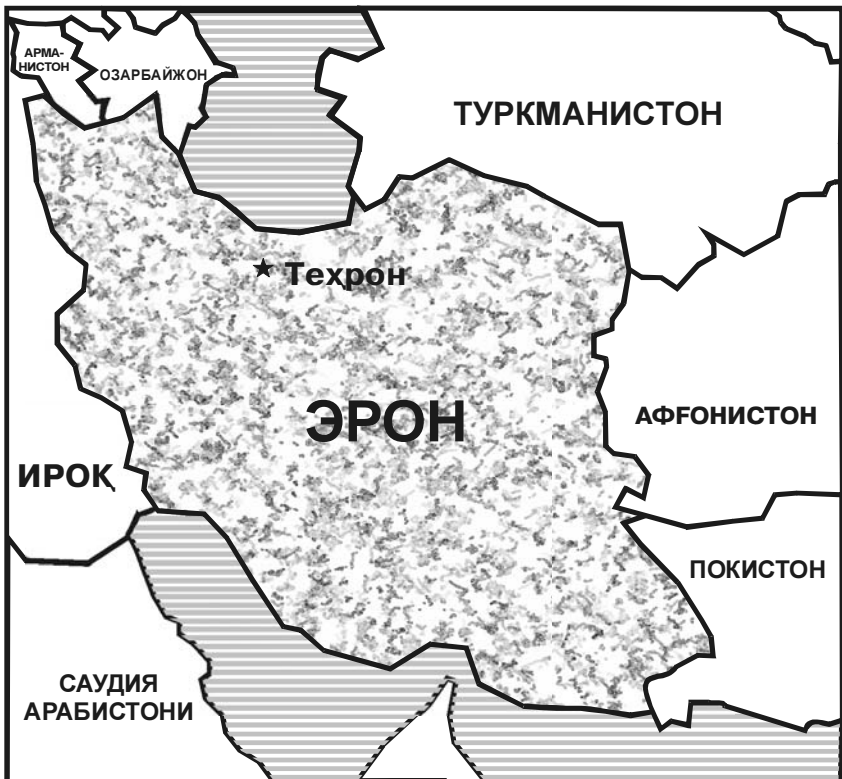
Эрон ва унга чегарадош давлатлар

ерда ислом инқилоби ғояларини тарқатишга ҳаракат қилади, деган фикрлар илгари сурилган эди. Бироқ Эрон ташқи сиёсати анча узоқни кўзлаб иш тутди. Диний омил асосан суннийлар яшайдиган ва дунёвий демократия қуришга интилиш кучли бўлган Марказий Осиё жамиятларини Эрон билан боғлашдан ҳам кўра кўпроқ ундан узоқлаштиришини яхши тушунган Теҳрон ўзининг минтақадаги ташқи сиёсатида иқтисодий, маданий алоқаларни, гуманитар мулоқотни биринчи ўринга қўйди, тарихий, ахлоқий масалалардаги муштаракликка урғу берди.