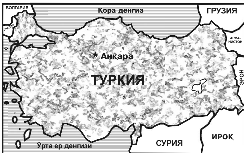
Туркия ва унга чегарадош давлатлар

дилар. Бу уринишларнинг энг машҳури «ёш турклар» ҳаракати деб ном қозонган. Лекин уларнинг биронтаси ҳам муваффақиятли бўлмади. Туркия Биринчи жаҳон урушида мағлубиятга учради, ҳатто қисқа вақтга ўз мустақиллигини ҳам йўқотди. Лекин турклар бу тенденцияга барҳам бериш учун кучларни сафарбар этишга муваффақ бўлдилар. Мустақиллик учун курашда туркларга янги Туркиянинг бўлажак асосчиси, кейинчалик Отатурк номини олган Мустафо Камол Пошо раҳбарлик қилди. 1916 йилги Дарданелла учун жанг қаҳрамони, 35 ёшида генерал унвонини олган Мустафо Камол халқни мамлакат яхлитлигини тиклаш учун курашга отланганди. Унинг ташаббуси билан 1923 йилда Туркия республика деб эълон қилинди. Мустафо Камол Отатурк кейинги 15 йил давомида, то ўлимига қадар мамлакат Президенти бўлди. У аждодларга дунёвий демократия институтлари ва анъаналарига эга мамлакатни қолдирди. Унинг таълимоти Туркияда отатуркчилик, Ғарбда эса камолизм деб баҳоланган. Бу таълимот асосан динни давлат ва маорифдан ажратиш, хотин-қизларга эркаклар билан тенг ҳуқуқлар бериш, григорианча йил ҳисоби ва латин алифбоси жорий этиш, халифалик ва шариат ҳуқуқини тугатишни ўз ичига олади. Туркия ташқи сиёсатига ғарб мамлакатлари билан ҳарбий-сиёсий ҳамкорлик хосдир. У 1952 йилдан бери НАТОнинг фаол ва аъзоли аъзоларидан бири ҳисобланади. Турк генераллари мамлакатда камолизм сиёса-