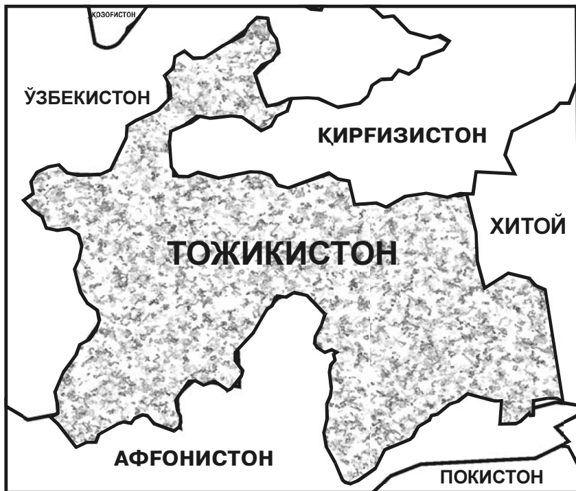
Тожикистон ва унга чегарадош давлатлар

Тожикистон тизма тоғлар билан қопланган мамлакат бўлиб, ҳудудининг ярми денгиз сатҳидан 3,000 метрдан ортиқ баландликда жойлашган. Шундай қилиб, Тожикистон иқтисодий ривожланишга салбий таъсир кўрсатувчи икки географик омил - ҳудуднинг тоғлилиги ва анклавлиги, яъни денгиз портларидан ажралганликни ўзида мужассамлаштирган. Қўшни мамлакатлар билан транспорт коммуникациялари ташқи бозорлар билан фаол алоқа қилиш учун