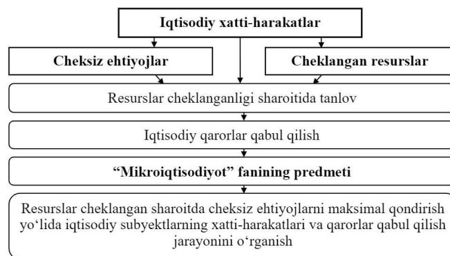
1.2-rasm. “Mikroiqtisodiyot-2” fani predmetining shakllanishi.

Iqtisodiy fanlarda qo'llanilgan ilk usul formal mantiq bo'lib, u fanga Aristotel tomonidan kiritilgan. Formal mantiq – bu g'oyani uning tarkibiy qismlari va shaklidan kelib chiqib o'rganishdir. Uning eng sodda kategoriyasi tushunchadir . Tushuncha predmet to'g'risidagi fikrni izohlaydi.