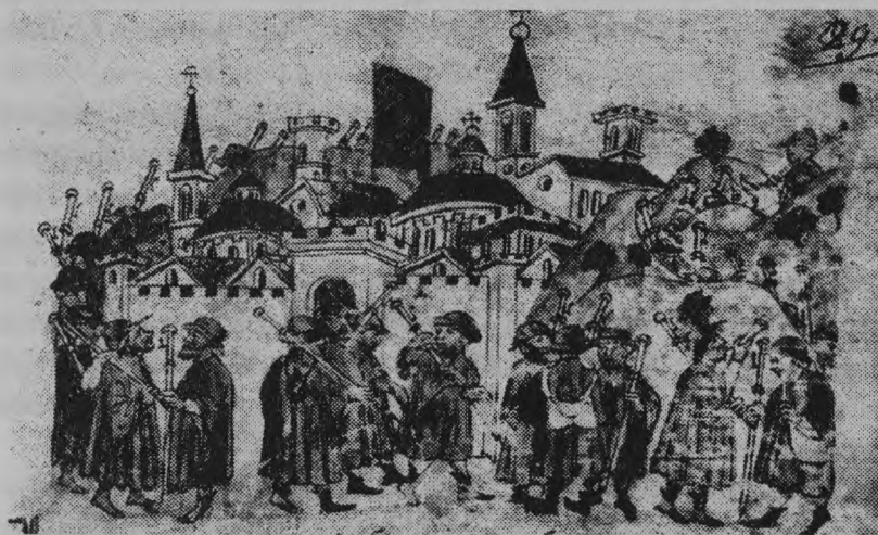
1-rasm. 1300 yilni nishonlash uchun Rimga boradigan ziyoratchilar.

Qadimgi Rimda, shuningdek, yo'riqnomalar mavjud bo'lib, ular nafaqat marshrutni, balki yo'l bo'ylab diqqatga sazovor joylarni ham ko'rsatib bergan. Qadimgi Rimning turizm sohasi bozorga terini shamol va quyoshdan himoya qilish uchun maxsus maskalar kabi narsalarni olib kelgan; yo'lda o'qish uchun kichik formatdagi kitoblar va boshqalar.