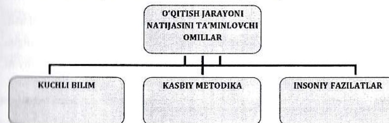
5-rasm. Pedagog faoliyati natijasini ta'minlovchi omillar

Bilimsizda pedagogik mahorat bo'lishiga ishonib bo'lmaganidek, o'qituvchining insoniy fazilatlarisiz ta'lim oluvchi mehrini va ishonchini qozonish qiyin. Pedagogda ushbu uchta xususiyat, ya'ni kuchli bilim, kasbiy metodika va insoniy fazilatlar bo'lishi lozim (5-rasm).