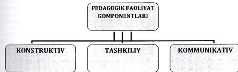
1-rasm. Pedagogik faoliyatda o'zaro bog'liq komponentlar