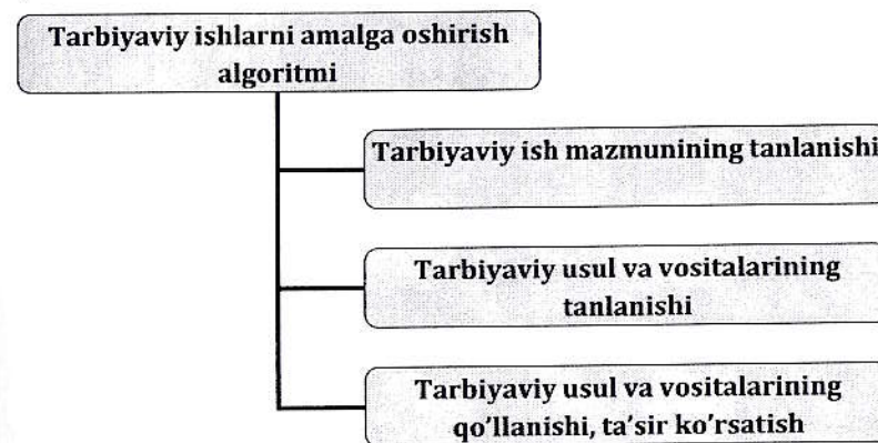
2-rasm. Tarbiyaviy ishlarni amalga oshirish algoritmi

Tarbiyaviy ishlarni amalga oshirish algoritmi tizimli tashkil qilinadi (2-rasm).