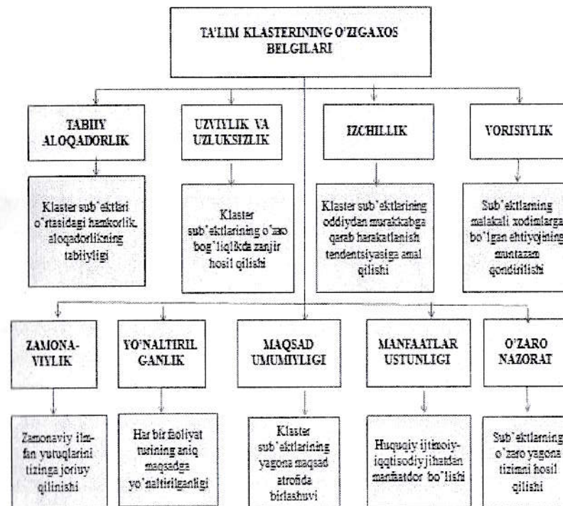
7-rasm. Ta'lim klasterining o'ziga xos belgilari

Ta'lim klasterining o'ziga xos sinergetik belgisi ham mavjud bo'lib, bunda tashqi ta'sirlardan kelib chiqadigan va mavjud oddiy tizimlardan farqli o'laroq, klasterlar asosan ichki resurslar hisobiga ishlaydi.