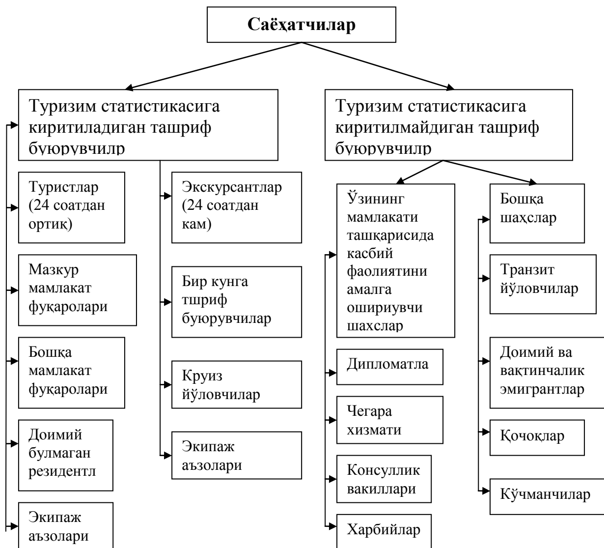
1.1-расм. Саёҳат қилувчи шахсларнинг таснифи.

Халқаро туризмнинг хусусиятли жиҳати шундаки, бу соҳага сарфланган инвестициялар чет эл валютаси сифатида қайтиб келади. Ўзининг иқтисодий моҳиятига кўра чет эл туризми маълум мамлакатга ва қтинча ташриф буюрганлар учун моддий ва маданий бойликлар, товар ва хизматларнинг алоҳида истеъмоли бўлиб ҳисобланади.