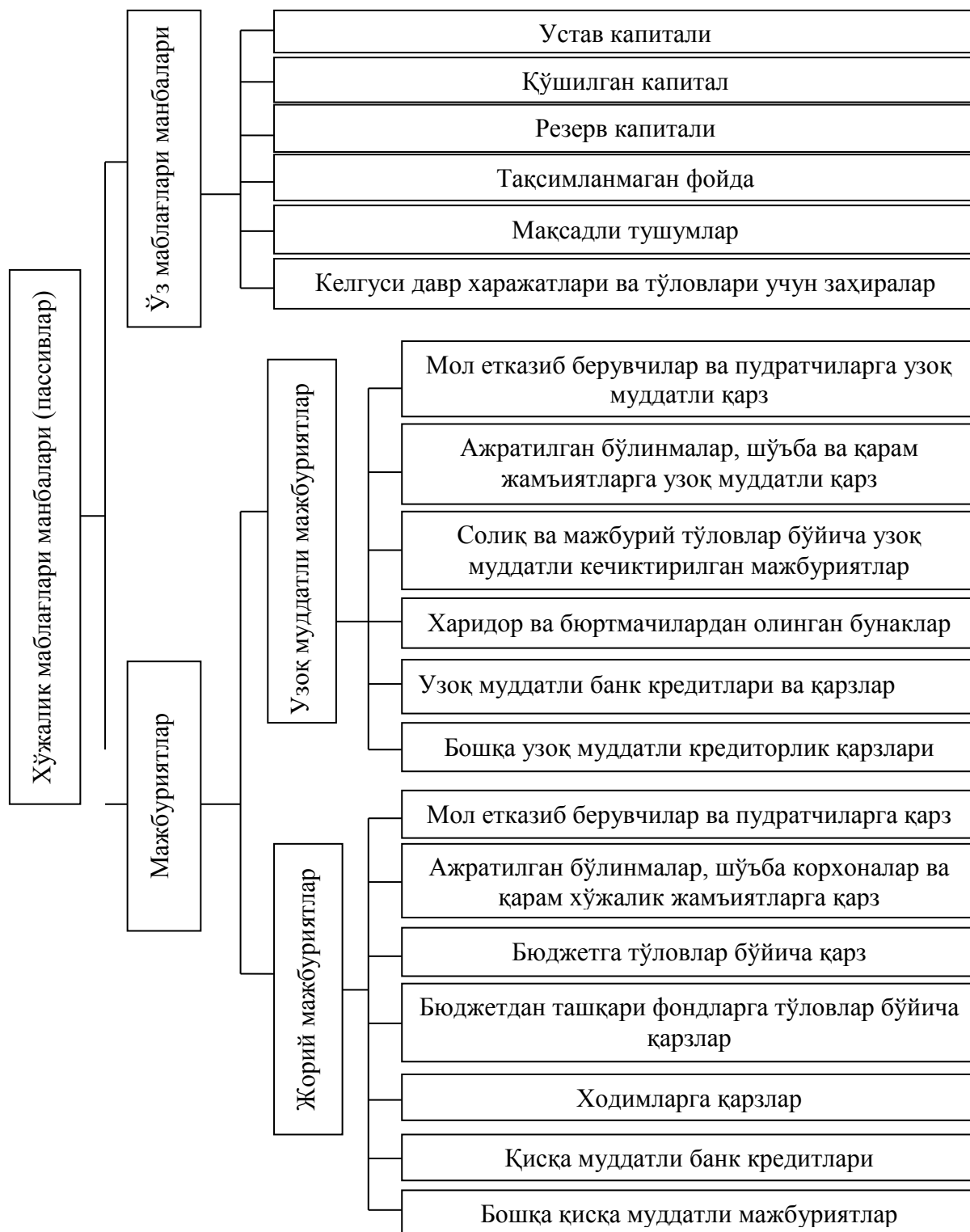
1.4-чизма. Корхона маблағлари манбалари (пассивлари)нинг туркумланиши

Келгуси давр харажатлари ва тўловлари учун захираларга харажатлар ва тўловларни харажатларга бир текисда қўшиш учун белгиланган тартибда ташкил этиладиган захиралар киради.