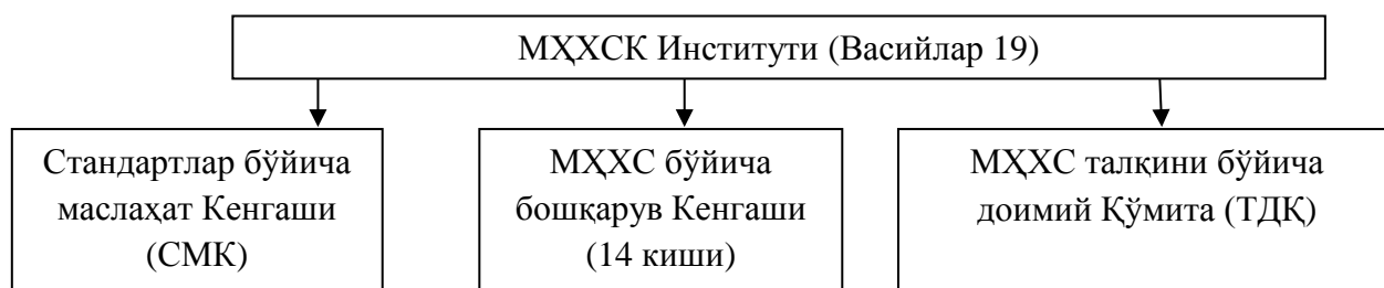
1.1-чизма. МҲХСК институти таркиби

МҲХСК институти васийларининг асосий вазифалари: