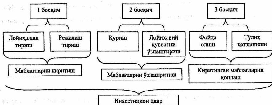
1.3-расм. Инвестицион даврнинг давомийлиги.

маблағларни намоён қилади. Инвестицион давр — бу янги ташкилот ва объектларни яратиш, ёки амалдагиларни кенгайтириш ва реконструкция қилиш даври. У ўз ичига уч босқични олади: маблағларни киритиш (режалаштириш ва лойиҳалаштириш), маблағларни ўзлаштириш (лойиҳавий қувватларни қуриш ва ўзлаштириш), киритилган маблағларни қоплаш. Шу билан бирга киритилган маблағларни қоплаш деганда, олинган даромад ҳисобига уларнинг тўлиқ ўз—ўзини қоплаши ҳисобланади. Инвестицион даврнинг давомийлиги (1.3-расм) лойиҳалашнинг бошланишидан то киритилган маблағларнинг тўлиқ қопланишигача бўлган вақт оралиғи билан белгиланади.