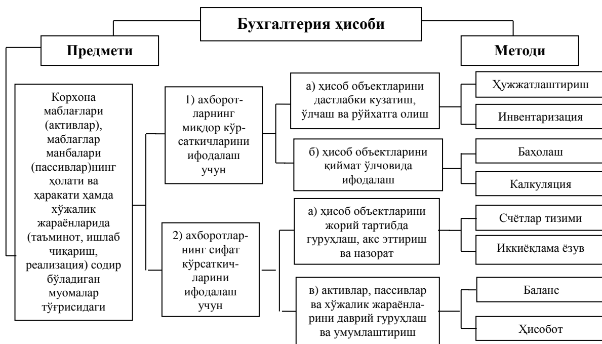
1.5-чизма. Бухгалтерия ҳисоби предмети ва методининг ўзаро боғлиқлиги

Шундай қилиб, бухгалтерия ҳисоби предмети ва методи ўртасида ҳам сабаб-оқибатли диалектик боғлиқлик мавжуд (1.5-чизма).