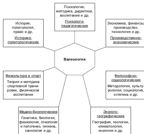
Рис. 1. Взаимодействие валеологии с другими науками

Взаимосвязь валеологии с другими науками. Каждому этапу развития человеческого общества свойственен определенный прогресс развития науки. В значительной степени это относится к наукам о здоровье человека. Однако сами понятия здоровья и обеспечивающих его факторов настолько сложны и многогранны, что оказались предметом рассмотрения многих наук, каждая из которых изучает лишь определенные аспекты этих основополагающих вопросов. В результате изучение проблем здоровья и путей его обеспечения оказалось предметно разорванным. Вобрав в себя достижения многих наук (рис. 1) и взяв за основу достижения наук о человеке – биологии, генетики, физиологии, психологии и многих других сторон его жизнедеятельности – валеология создает интегральное знание по диагностике, прогнозу и управлению здоровьем человека.