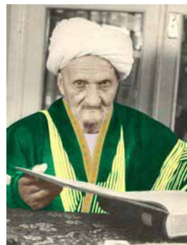
Eshon Boboxon ibn Abdulmajidxon (1856-1957)