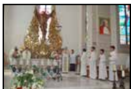
Toshkentdagi Rim-Katolik cherkovida tadbir