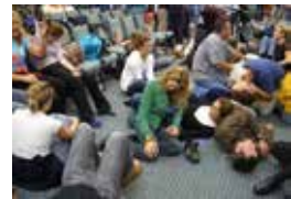
Prozelitizmning ayanchli ko'rinishi