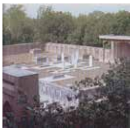
Samarqand. Mahdumi A'zam maqbarasi

dunyoqarashi islom sivilizatsiyasi bilan chambarchas bog'liq holda shakllanib, rivojlanganini Samarqand, Buxoro, Xiva, Toshkent, Kesh, Nasaf, Termiz, Andijon, Marg'ilon, Karmana, Qo'qon singari qadimiy shaharlarimiz, ulug' allomalar va aziz-avliyolar xotirasiga bag'ishlab yurtimizda bunyod etilgan yodgorlik majmualari, muqaddas qadamjolar maketlari, ulug' siymolar, noyob qo'lyozma va toshbosma asarlar, moddiy va nomoddiy meros, xususan, «Shashmaqom» namunari kabi noyob eksponatlar orqali aks ettirish, shu yo'nalishlarda ilmiy tadqiqotlar olib borish, ularning natijalari asosida qomuslar, katalog va albomlar, ilmiy-ommabop to'plamlar, teleko'rsatuv, film va boshqa materiallar tayyorlash;