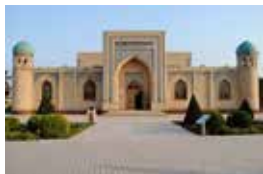
Abduxoliq G'ijduvoni maqbarasi.

Tariqatchilar tomonidan shariat talablarining noto'g'ri talqin qilinishi, an'anaviy islom tamoyillariga zid bo'lgan qoidalar ishlab chiqilishi odamlar o'rtasida noroziliklar kelib chiqishiga sabab bo'lmoqda.