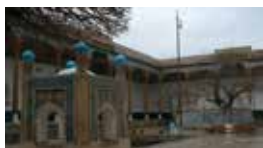
Bahouddin Naqshband maqbarasi.