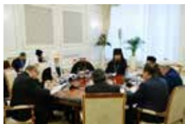
Butun Rossiya pravoslav cherkovi patriari Kiril bilan davra suhbat