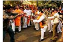
Missionerlikning keltirib chiqargan oqibati

– bolalar va o'smirlarni yoz faslida tog'li hududlardai dam olish lagerlariga jalb qilish va shu yerda ta'sir o'tkazish;