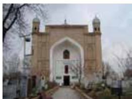
Shayx Zayniddin maqbarasi