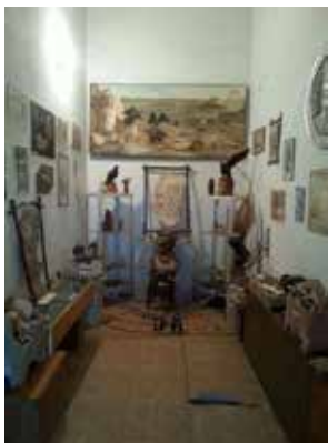
Xivadagi Avesto muzeyi eksponatlari

ga e'tiqod qiluvchilarning soni juda ko'p emas. Jahon miqyosida zardushtiylikning diniy manbasi Avestoni o'rganish «avestoshunoslik» nomini olgan. Hozirda AQSh, Rossiya, Eron, Hindiston davlatlarida yirik avestoshunoslik markazlari mavjud. Ularda olib borilayotgan tadqiqotlar ulkan tajriba va an'analarga ega.