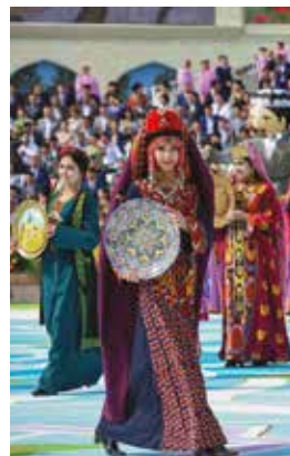
«Assalom Navro'z» tadbiri

da. Shundan 9018 ta maktabda o'zbek tilida, 903 ta maktabda rus tilida, 365 ta qoraqalpoq tilida, 378 ta maktabda qozoq tilida, 245 ta maktabda tojik tilida, 44 ta maktabda turkman tilida, 90 ta maktabda qirg'iz tilida ta'lim berish yo'lga qo'yilgan.