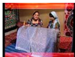
Chaqaloqni beshikka solish marosimi