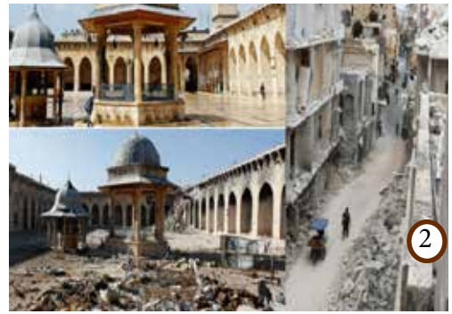
Terrorizm millat va din tanlamaydi. Suriya