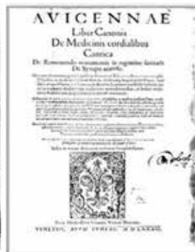
Abu Ali ibn Sinoning XIV asrda Italiyada nashr etilgan «Tib qonunlari» kitobiga ishlangan gravюра