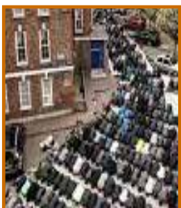
Londonda ibodat marosimlari