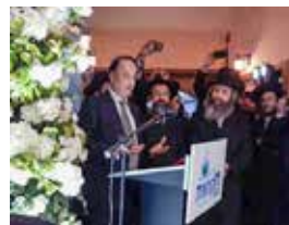
Buxoro yahudiylari kongressi

O'zbekiston ko'zi ojizlar uchun maxsus Brayl yozuvida Qur'oni karimni nashr qilgan uchinchi mamlakat hisoblanadi.