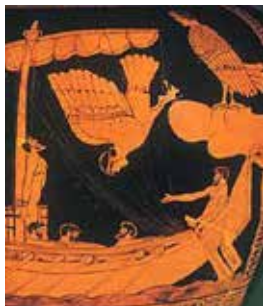
Gomer. «Odiseya» dostoni qahramonlari

Ushbu asarlar orqali qaysi davrga oid dinlar haqida ma'lumot olish mumkin?