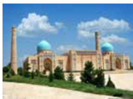
Hazrati Imom (Hastimom) majmujasi