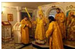
Xorazmda pravoslav cherkovida ibodat marosimi