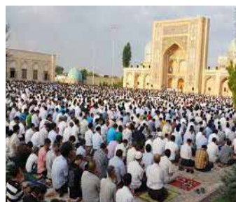
Jahon va milliy dinlardagi ibodat marosimlari