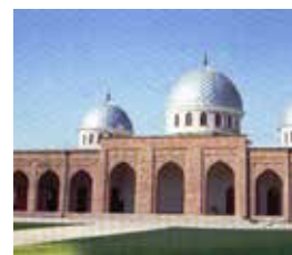
Xoja Ahror Valiy masjidi