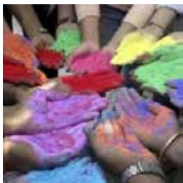
Xoli bayrami (Hindiston)