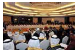
IHT Tashqi ishlar vazirlar kengashi yig'ilishi