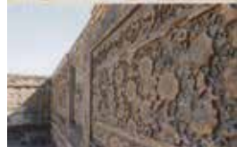
Chor Bakr memoriy majmuasi, XVI-XX asr boshlari