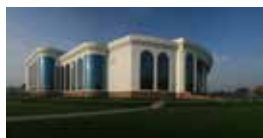
Alisher Navoiy nomidagi milliy kutubxona

Tarix fanida olgan bilimlaringiz asosida Islom madaniyati poytaxti nomini olgan shaharlar tarixi haqida malumot bering. Bunda ISESCO tomonidan shaharlarni Islom madaniyati poytaxti deb e'lon qilinishiga oid talablardan foydalaning.