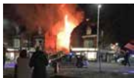
Buzg'unchilik va fitna oqibati

– o‘z maqsadlari yo‘lida davlat va jamiyatda ijtimoiy-siyosiy barqarorlikni izdan chiqarishga qaratilgan xatti-harakatlarga urg‘u berish;