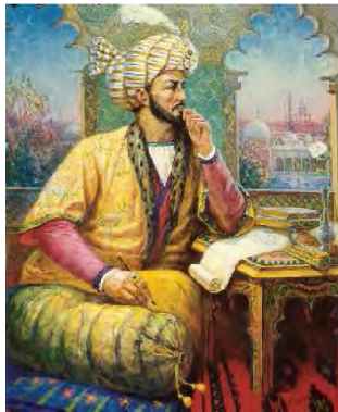
Zahiriddin Muhammad Bobur

Movarounnahrning nufuzli davlat arboblari shayxulislom Abulmakorim boshchiligida Bobur Mirzoni Samarqand taxtini egallashga da'vat etdilar. Sulolasi manfaatiga sadoqatli bo'lgan Bobur Mirzo 1500-yilning kuzida Samarqandga yurish boshladi va taxtni ikkinchi marta egalladi.