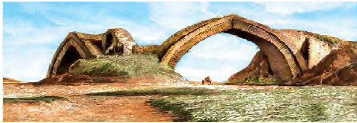
Zarafshon daryosida qurilgan ko'prik – suv ayirg'ich