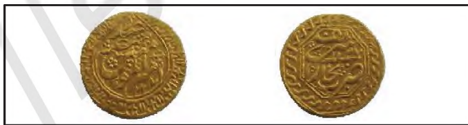
1809-yilda zarb etilgan oltin tanga (Xiva)

Soliq tizimida o'tkazilgan islohotga ko'ra, soliqlarning muntazam undirilishi ta'minlandi. Bunga yerdan olinadigan soliqning mahalliy hokimlar tomonidan yig'ilishiga chek qo'yish, soliqlarning xon tomonidan tayinlangan davlat amaldorlari tomonidan yig'ilishi tartibining o'rnatilishi orqali erishildi. Ayni paytda, yer solig'ining ancha qismi pul shaklida yig'iladigan va ularning hammasi umumdavlat xazinasiga topshiriladigan bo'ldi. Shuningdek, bojxona xizmatining tashkil etilganligi va oltin tangalar zarb etilib muomalaga chiqarilganligi davlat xazinasiga tushumning ko'payishiga xizmat qildi. Muhammad Rahimxon I mamlakatda ichkilikni taqiqladi.