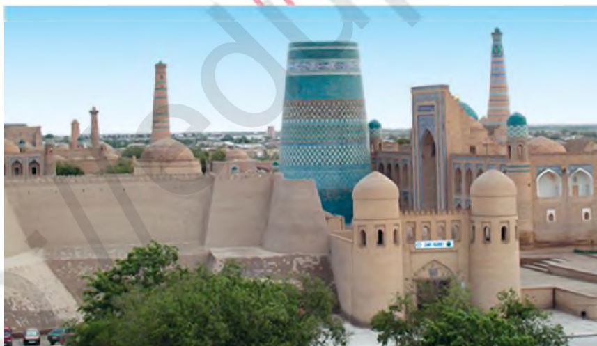
Xiva. Ichan qal'a

Ichan qal'a Ichan qal'a bobolarimizdan qolgan O'rta Osiyodagi yirik va noyob me'moriy yodgorlikdir. Ichan qal'a Xiva shahrining ichki qal'a (Shahriston) qismidir. Ichan qal'a Dishan qal'adan devor bilan ajralib turadi. Unga Bog'cha, Polvon, Tosh va Ota deb nomlangan to'rtta darvoza orqali kirilgan. Xorazm o'lkasi me'morchiligining ajoyib obidalari – madrasa, masjid, xon saroyi, ma'muriy binolar, bosh maydon va minoralar Ichan qal'ada joylashgan. Muhammad Rahimxon, Olloqulixon va Muhammad Aminxon hukmronliklari davrida Ichan qal'ada keng ko'lamli bunyodkorlik ishlari amalga oshirildi. Muhtasham saroy, madrasa va maqbaralar barpo etildi. Ko'hna arkdagi saroy qurilishi tugallandi. Muhammad Aminxon Ichan qal'aning g'arbiy qismidagi Ko'hna ark yoniga Kalta minor nomi bilan mashhur bo'lgan minorani qurdirdi.