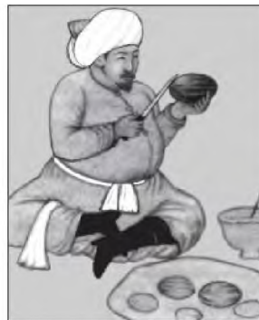
Abdullaxon II (miniatura, 1572)

Muhammad Islom va uning avlodlari o‘zlarining kelib chiqishini ota tomonidan Muhammad payg‘ambar avlodlariga, ona tomonidan esa Chingizxon va Jo‘jiga bog‘lar edilar. XVI asrning ikkinchi yarmida Mu-