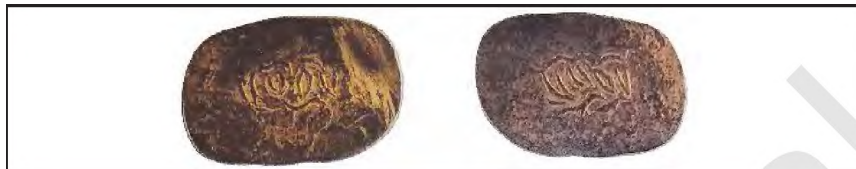
Mis tanga. XVI asr

paytda, dehqonlarning soliq to'lash imkoniyatini oshirishga, davlat mulkini ko'paytirishga xizmat qildi.