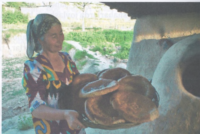
Rasm. 5. Qishloq uyida.

Ushbu o'zaro to'qnashuv va o'zaro ta'sirdan qishloq va ekologik turizm nafaqat foyda keltiradi. Mamlakatimizga tashrif buyuruvchilarni nima o'ziga jalb qiladi? Chet ellik sayyohning nazarida nima shunchalik g'ayrioddiy ko'rinadi? Birinchidan, bu O'zbekistonning o'ziga xos sayyohlik brendlari: o'ziga xos ko'p qavatli tabiat, noyob sharq me'morchiligi, teraklar va tul qatorlari bilan o'ralgan manzarali qishloqlar, toshli uylar, eshaklar, tuyalar, sharqona taom, mehmondo'stlik, dasturxon, choy.