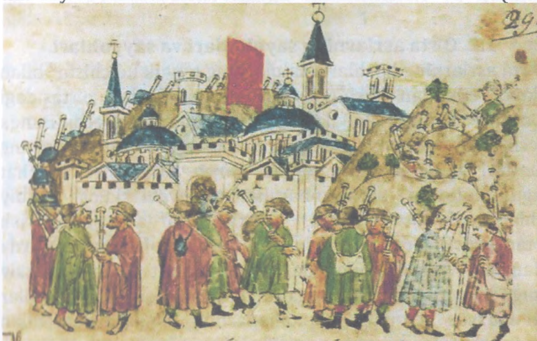
Rasm.1. 1300 yilni nishonlash uchun Rimga boradigan ziyoratchilar

Sayohat go'zal yo'llarning mavjudligi tufayli amalga oshirildi. Rim yo'llari barcha muhandislik qoidalariga binoan qurilgan. Suv to'siqlarini engib o'tish uchun ko'priklar va viyaduklar qurildi. Siz tunashingiz mumkin bo'lgan stantsiyalar belgilanadigan maxsus yo'l xaritalari mavjud edi. Har bir stantsiyaning o'ziga xos xususiyati taverna edi (1-rasm).