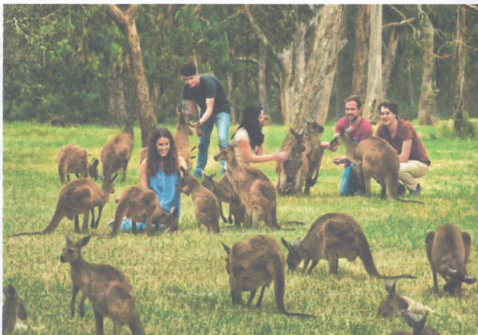
Rasm-3. Elis Springs maxsus parkida.

Tasmaniya orolining 30% hududi “Butun jahon merosi” obyektlari ro’yxatiga kiritilgan. Orolning eng mashhur marshruti - Overland Trek, Kreydl-Mauntin-Lyek, Sankt-Kler milliy bog’i orqali shimoldan janubga o’tadi. Janubi-g’arbiy Yangi Zelandiya bog’i Yangi Zelandiyaning Janubiy orolida tashkil etilgan. Fjerdland milliy bog’i taxminan 500 km sayohat yo’llarini taklif etadi.