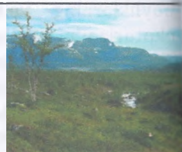
Strua Chealfet milliy parki

landshaftlar, qat'iy qo'riqlanadigan qo'riqxonalar, ilmiy qo'riqxonalar, tabiatni boshqarish qo'riqxonalari va tabiat yodgorliklari mavjud. Shimoliy Yevropa ekologik turizm uchun eng qiziqarli hisoblanadi. 1909-yilda Shvetsiyada birinchi milliy parklar - Strua Chealfet va Sarek tashkil etildi. Shvetsiya, Norvegiya, Finlyandiya va Rossiya hududlarini o'z ichiga olgan Laplandiyada Yevropadagi eng yirik yovvoyi tabiat qo'riqxonasi bo'lib, umumiy maydoni 4 ming km 2 bo'lgan milliy bog'lar yaratildi. Laplandiyaning Arktika doirasidan tashqarida ikkita yirik qo'riqxonasi bor - Finlyandiyaning eng katta milliy bog'i - Lemmenjoki va Norvegiya milliy bog'i - Yevre-Anarjokka. Shimoliy qutb doirasida joylashgan Finlyandiya, Shvetsiya va Norvegiyaning milliy bog'lari tabiatni muhofaza qilish choralari 70 ming aholisi bo'lgan tub aholisi ehtiyojlarini hisobga olgan holda birlashtiradi. Finlyandiya eng katta milliy bog'lar - Pallas-Ounastunturi, Oulanka. Qishda, itlar va kiyik chanalarida, qor mototsikllarida uzoq yurish paytida sayyohlar Sami-kote milliy uyiga tashrif buyurishadi. Yozgi ochiq havoda dam olishning turli xil variantlari mavjud: tepaliklarda piyoda yurish, tog' velosipedi, kanoeda, baydarka eshkak eshish yoki tez yurish.