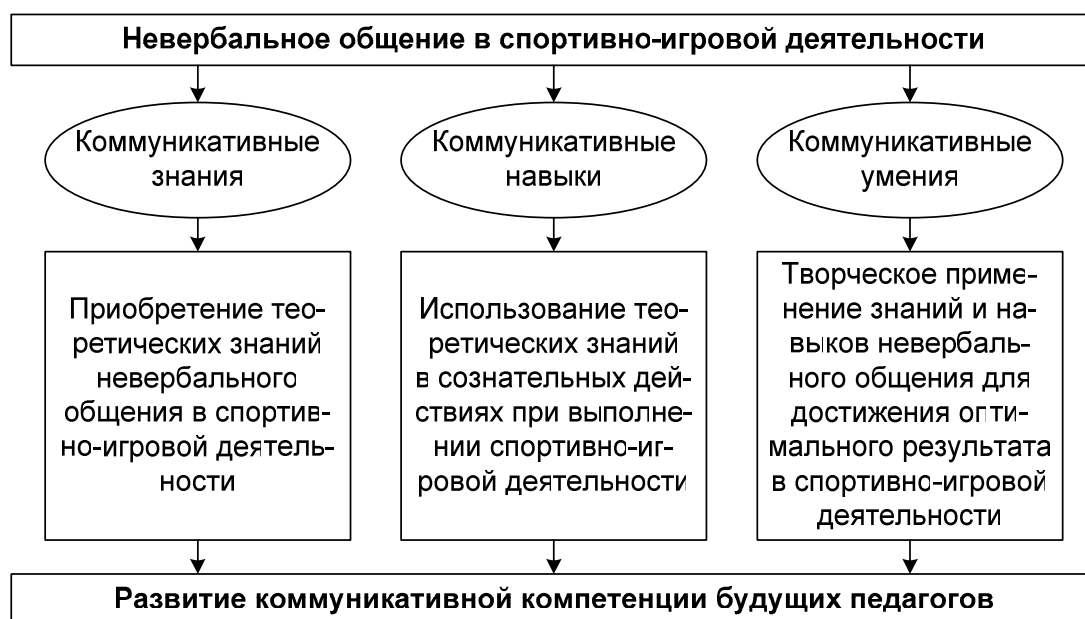
Рис. 3. Модель формирования коммуникативной компетенции средствами невербального общения в спортивно-игровой деятельности

ния в процессе физкультурно-спортивной деятельности на примере спортивных игр. Данная модель представлена на рис. 3.