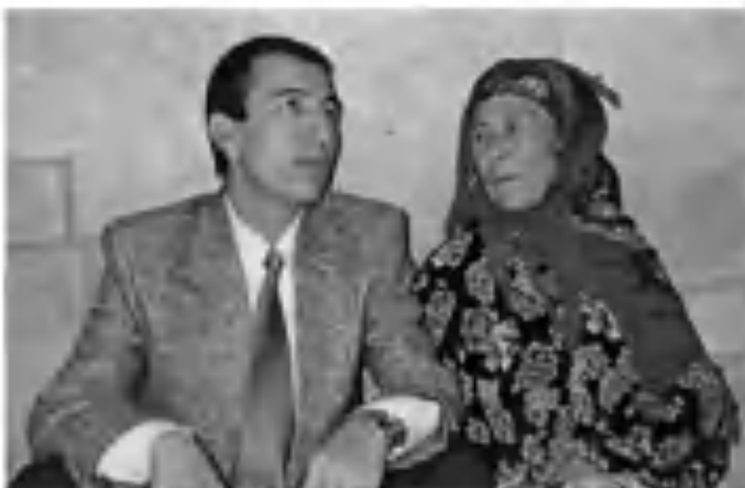
«Онажон, бу олам бунчалар чексиз!». 2004 йил.