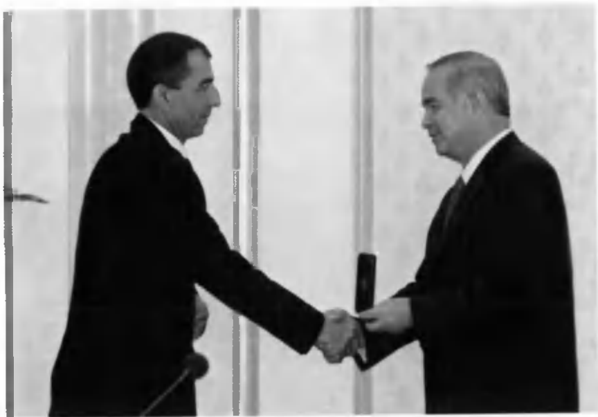
«Эгаси бор юртнинг — эртаси бордир» «Ўзбекистон Республикаси халқ шоири» унвони катта ижодий вазифалар юклайди. 2006 йил.