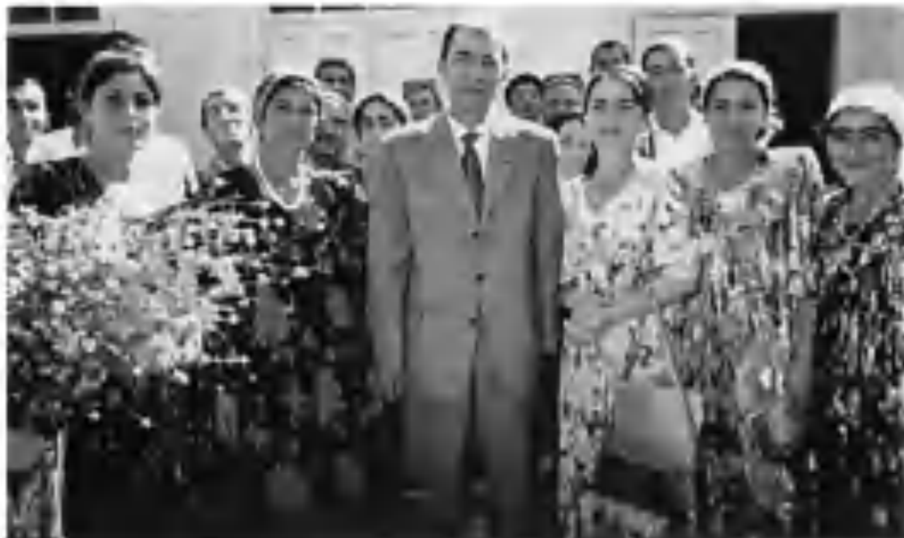
Мактабимда учрашув. 2004 йил.