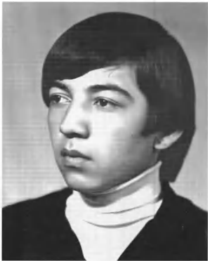
«Келажакка нигоҳ» Журналистика факултети талабаси. 1977йил.