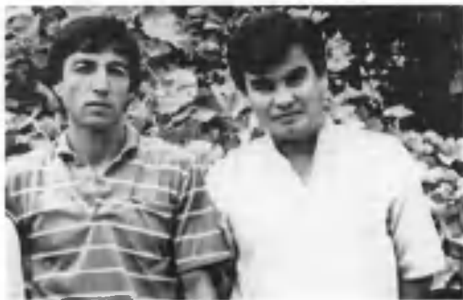
«Карвон кўрдим туялари бўзлаб борар» Ўзбекистон халқ шоири Усмон Азим. 1987 йил.