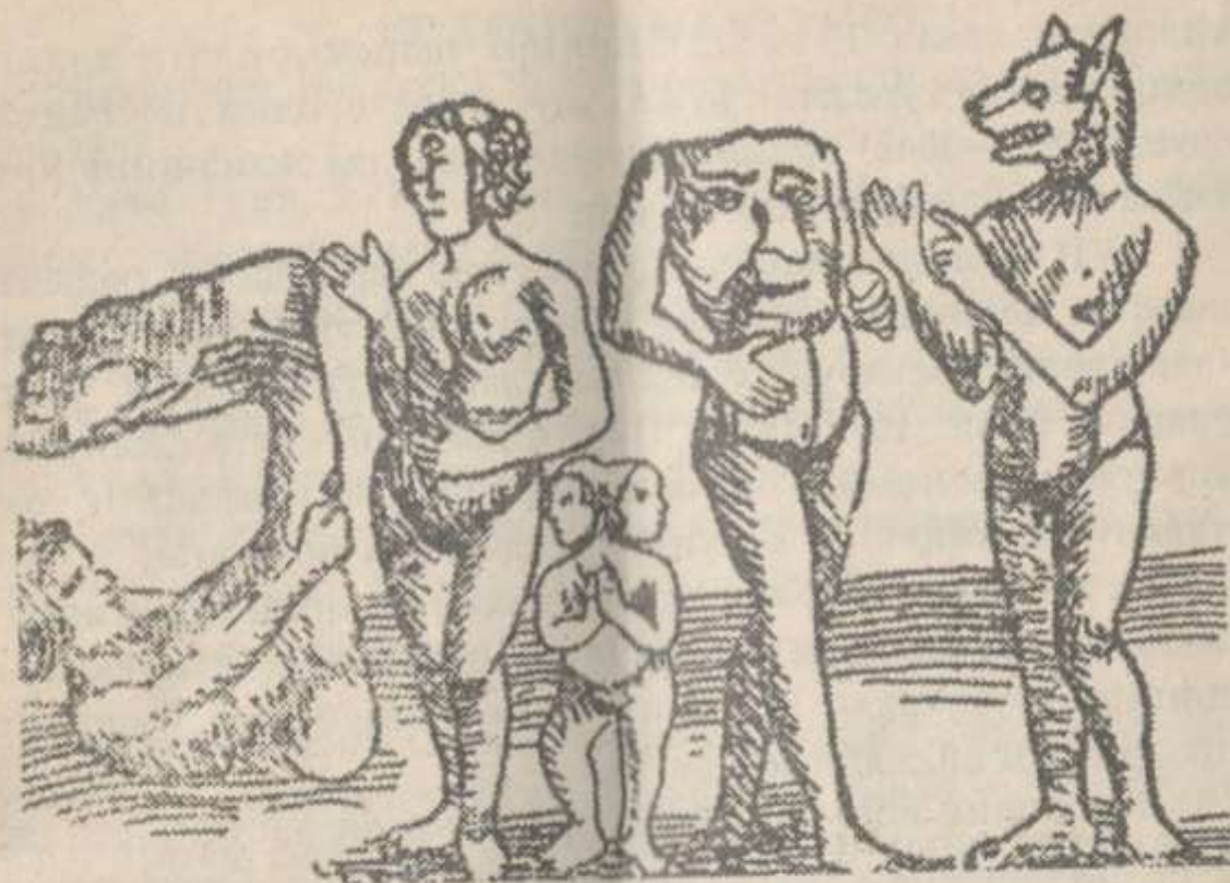
Қадимги одамлар бошқа ўлкаларнинг халқларини мана шундай тасаввур этганлар