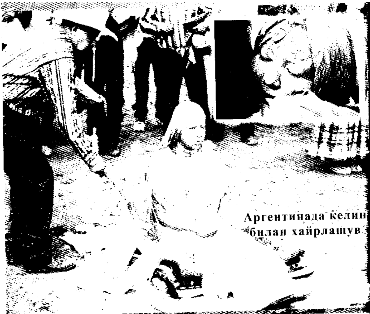
Аргентинада келин билан хайрлашув