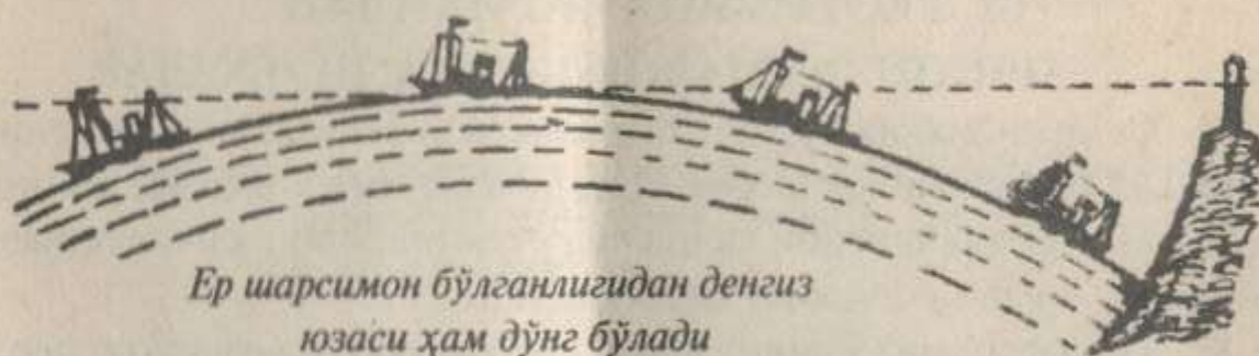
Ер шарсимон бўлганлигидан денгиз юзаси ҳам дўнг бўлади

пешқадам вакиллари, олимлар Ой ва Куёш каби Ер ҳам осмон жисмидир, унинг чеккаси йўқ, у шарсимон шаклда, деган фикрга кела бошлайдилар.