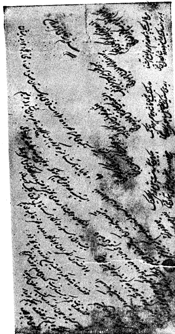
Муқимийнинг 1889 йил ёз ойларида Қўқондан Тошкентга, дўстлари Маҳмудхўжа билан мулла Каримжон (шоир Камий) ларга ёзган мактуби. Мактубнинг автографи Ўз. Ф. А. Шарқшунослик, институтида, Х. Х. Ниёзий фондида (инв. № 7623, папка XXII) сақланмоқда.

Зиёда атолат мужиби малолат, аддуою вассалом камина ҳақир Муқимий. 1