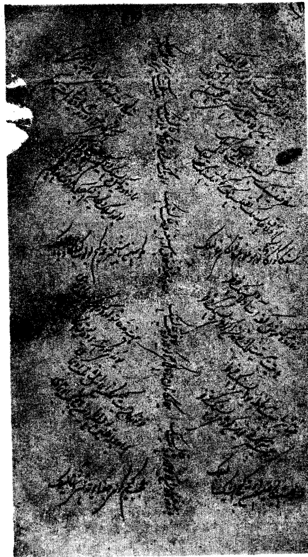
Муқимийнинг „Лайлак“ сарлавҳали сатирасининг муътабар қўлёзма нусхаси. Алоҳида қоғозга ёзилган бу нусха шоир ва драматург Собир Абдулланинг шахсий кутубхонасида сақланади.