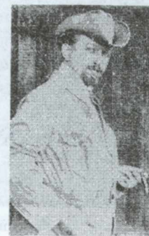
22-rasm. Leo Frobenius

Ratselning shogirdi – arxeolog, etnolog, folklor-Shunos Leo Frobenius (1873–1938) diffuzionizm doirasida « madaniy morfologiya » nazariyasi va « madaniyat xalqlari » g'oyalari asoschisi bo'ldi. Frobenius aslida afrikaShunos bo'lib, Afrika, Avstraliya va Okeaniya xalqlari madaniyatlarini o'rganish uchun 12 ta ekspeditsiya uyushtirgan. U tuzgan Afrikaning etnologik xaritasi hozirga qadar o'zining ilmiy ahamiyatini yo'qotgan emas. Ekspeditsiya materiallari va ularning nazariy tahlillari Frobeniusning fundamental asari – « Amerika madaniyatlarining kelib chiqishi » (1898) da ba-