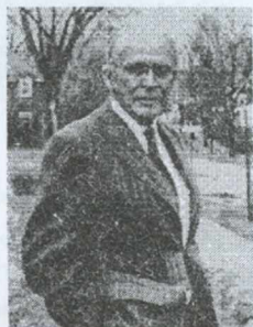
10-rasm. Lesli Uayt

Neoevolutsionizm g'oyalari AQSHda alohida o'rin tutib, kulturolog va etnolog Lesli Alvin Uayt (1900–1975) asarlarida o'z ifodasini topgan. Madaniyat haqidagi g'oyalar va umumiy konsepsiyalarini Uayt « Madaniyat haqida fan » (1949), « Madaniyat evolutsiyasi » (1959) va « Madaniy tizimlar tushunchasi – qabilalar va millatlarni tushunish kaliti » (1975) fundamental asarlarida bayon etgan.