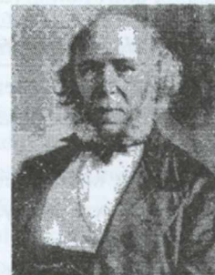
18-rasm. Gerbert Spenser

Spenser g'oyasining asosi jamiyat va inson organizmining qiyoslanishida edi. Jamiyat va madaniyatlarining turli tiplarini u ma'lum « ilohiy tana » tarzidagi, doimiy taraqqiyotdagi borliq si-