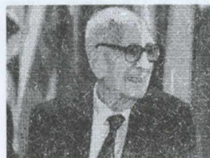
9-rasm. Klod Levi-Stross

Keyingi yarim asr davomida tarixiy antropologiya fanida ko'plab yangi nazariy-metodologik qarashlar hamda g'oyalar paydo bo'ldi. Shubhasiz, bunday qarashlarning paydo bo'lishi dunyo miqyosidagi siyosiy jarayonlarning o'zgarishi bilan bog'liq. Bu davrda Yevropa antropologlari tomonidan bir qator yangi nazariyalar yaratildi. Ayniqsa, ikkinchi jahon urushidan so'ng mustamlakac-