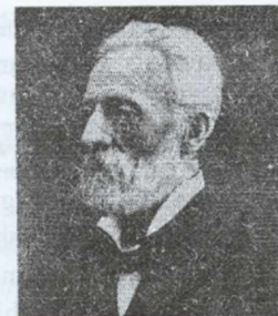
19-rasm. Adolf Bastian

Nemis antropologiyasi va evolyutsionizmning Germaniyadagi asoschisi Adolf Bastian yirik nazariyotchi va fan tashkilotchisi edi. Dunyoning turli hududlaridagi 9 ta ilmiy ekspeditsiya davomida to'plagan ma'lumotlari unga ilmiy konsepsiya yaratish imkonini berdi. Bastian g'oyasining muhim tomoni unda insoniyat tarixining soddalikdan murakkablikka tomon yuksalishi izohlangani bo'ldi. U o'z tadqiqotlarida barcha odamlar dunyoqarashining o'zagiga – psixologiyaga e'tibor qaratdi . Bastianning fikricha, ibtidoiy odamlar tarixiy-geografik muhitga moslashuv borasida elementar, deyarli psixik strukturaga ega bo'lishgan. Insonlar ruhiyatining o'xshashligini turli xalqlar o'tmishidagi ertaklar, afsonalar ayrim g'oyalardagi umumiylikda ham kuzatishimiz mumkin. Har bir xalq o'z g'oyalari majmuasini yaratadi va ular ushbu xalq madaniyatining mohiyatini belgilaydi .