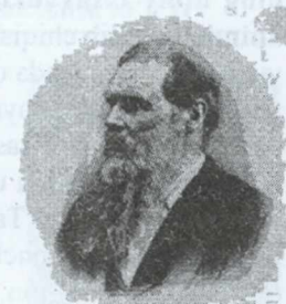
17-rasm. Eduard Bernett Taylor