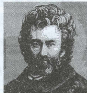
25-rasm. Nikolay Mikluxo-Maklay

PAPUASLAR ( malayyacha papuwa – jingalak) – xalqlar guruhi, G'arbiy Melaneziyaning tub aholisi. Yangi Gvineya oroli va Timor orolining Sharqiy qismi tub joy aholisining katta qismining umumlashgan nomi (enga, chimbu, xagen, kamano, xuli va boshqalar). Umumiy soni 4,8