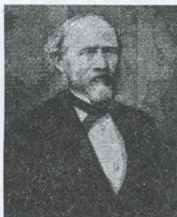
20-rasm. Lyuis Genri Morgan

Tarixiy antropologiyada evolutsionizmning shakllanishida amerikalik olim Lyuis Genri Morgan alohida o'rin tutadi. Morgan antropologiyaga o'ziga zamondosh bo'lgan barcha hamkasblarining umumiy xizmatidan ko'proq hissa qo'shgan, desak mubolag'a bo'lmaydi. Umrining deyarli 40 yilida dastlab AQSH hindu qabilalarini, so'ngra dunyoning boshqa hududlaridagi xalqlarni o'rgandi. Morganning etnik muammolarga qarashlari « Qadimgi jamiyat » (1877) va « Ibtidoiy jamiyat » (1871) asarlarida o'z aksini topdi. Mazkur asarlarda olim antropologiyani uch asosiy muammosi : urug'chilik jamiyatining insoniyat tarixidagi o'rni va ahamiyati, oila-nikoh munosabatlari-ning shakllanishi tarixi hamda insoniyat tarixini davrlashtirishni tadqiq qildi.