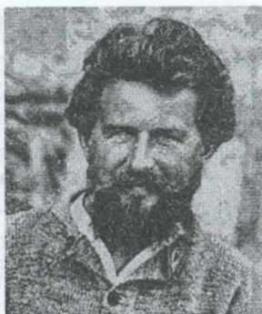
24-rasm. Frits Grebner

qil vujudga kelishi va taraqqiyotini o'rganish usullarini ishlab chiqish tadqiqotining asosini tashkil etdi. Bu masalalardagi o'z fikrlarini « Antropologiya metodi » (1911) asarida bayon etdi.