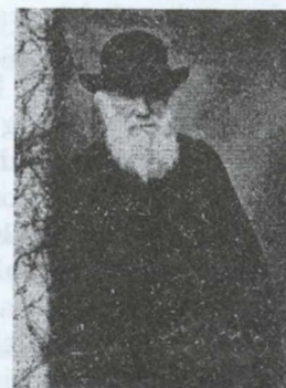
16-rasm. Charlz Robert Darvin

Tarixiy antropologiyada evolutsion nazariya asoschisi deb haqli ravishda ingliz olimi Eduard Taylor tan olinadi. U 1865-yili nashr qilingan « Insoniyatning qadimgi tarixiga oid tadqiqotlar » asarida o'z qarashlarini bayon etadi. Olim mazkur asarida insoniyat madaniyatining ibtido-