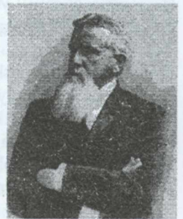
21-rasm. Fridrix Ratsel

Diffuzionizmning asoschisi deb Lyudvig Maksimilian nomidagi Myunxen universiteti professori, nemis geografi, etnolog, sotsiologi Fridrix Ratsel (1844–1904) tan olinadi. U birinchi bo'lib madaniy omillarning mamlakatlar va hududlardagi tarqalishi qonuniyatlariga e'tibor qa-